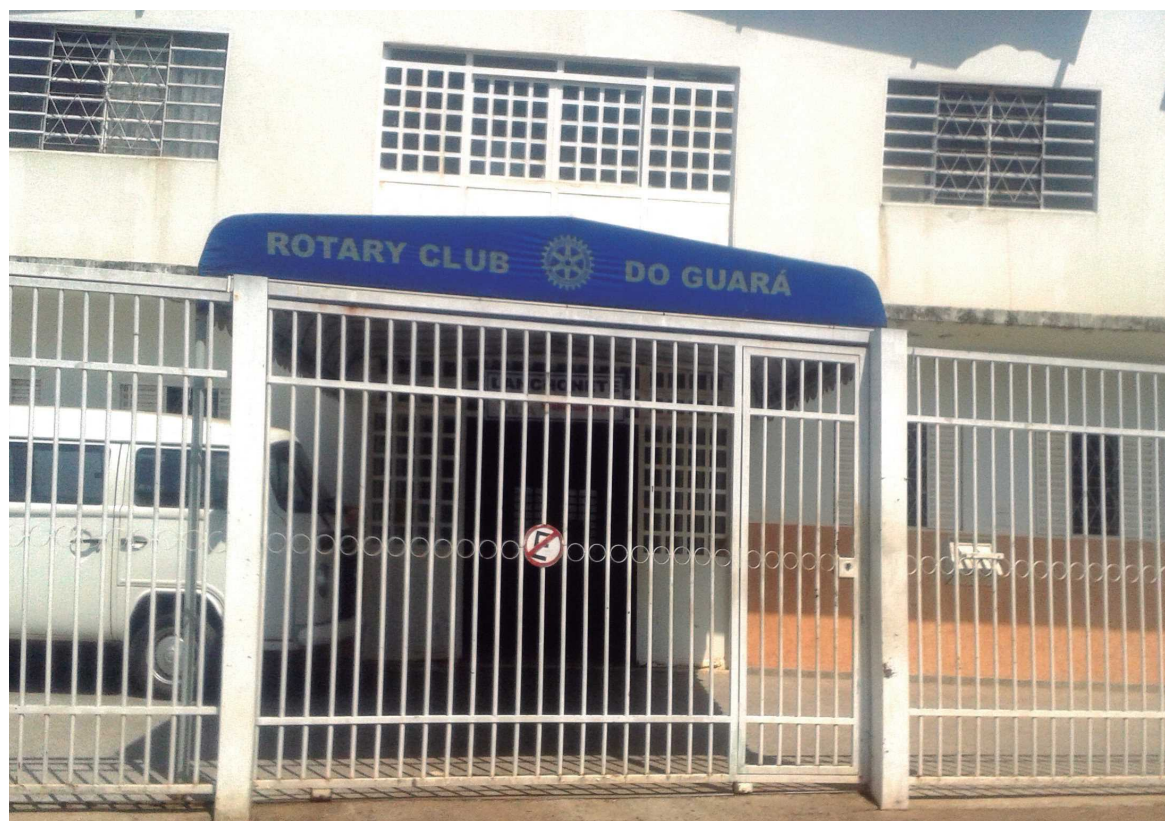
Lei beneficia instituições como o Rotary, a Maçonaria, centros espíritas e igrejas

De acordo com o governador Agnelo Queiroz, cerca de um terço dos terrenos do DF cedidos às instituições estava irregular. "Fizemos um grande