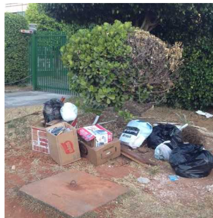
Esta é a imagem do domingo (Bosque dos Pinhais QE 4). Espero que seja publicada.

Participe do Jornal do Guará pelo WhatsApp