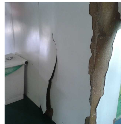
Foto da situação do Hospital do Guará. Fui com meu filho com febre e ele não conseguiu ser atendido.