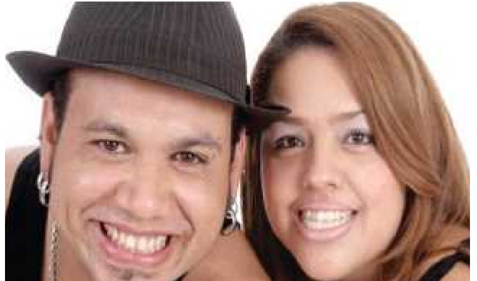
Asas do Forró (acima) e Trio Siridó (abaixo) serão as principais atrações

Uma das mais tradicionais festas do Guará, dos Maranhenses, volta no próximo dia 13 de setembro, sábado, no Salão de Múltiplas Funções do Cave, a partir das 21h.