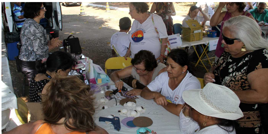
TEXTO LÍGIA MOURA

Evento promove a socialização e oferece atividades para a saúde