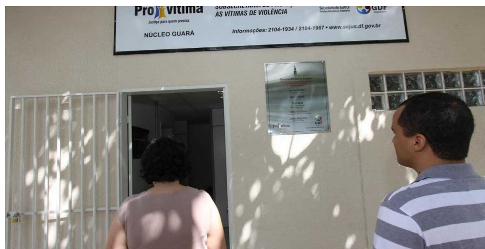
Unidade do Pró-Vítima do Guarά está instalada na quadra Lúcio Costa