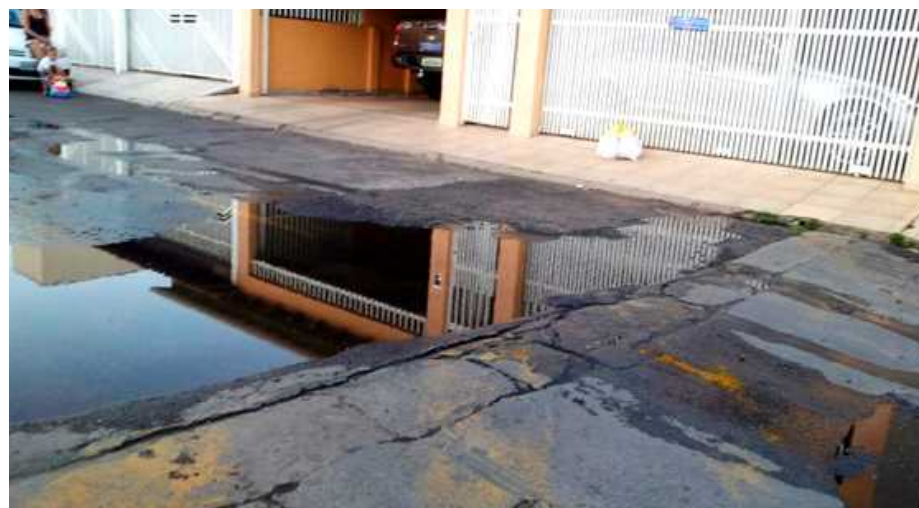
"Asfalto concentrando água, formando piscina, que permanece dias e dias. Em frente as Casas nº 26 e 25 do Conj. T da QE 15". Oswaldo Moraes

Participe do Jornal do Guará pelo WhatsApp