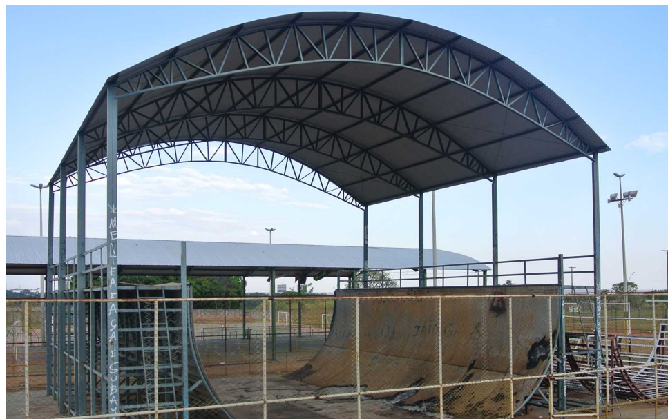
Half Pipe adquirido em 2009 para a disputa do Campeonato Brasileira de Skate Vertical está sem condições de uso e em local impróprio, ao menos por enquanto

O complexo fica próximo ao Teatro de Arena do Guará e da pista de bicicross, e é bem iluminado e tem amplo estacionamento. Estas reformas complementam os investimentos no local, que incluíram a construção neste ano de uma pista de aeromodelismo elétrico, a única de Brasília.