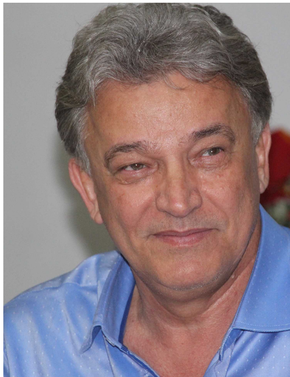
JF trabalha para trazer ao Brasil a tecnologia que transforma os resíduos orgânicos ou secos em energia elétrica e subprodutos para a construção civil

Uma das propostas de JF é criação da usina de plasma, de forma limpa e ecologicamente correta. Com esse projeto, segundo ele, todo lixo doméstico, hospita-