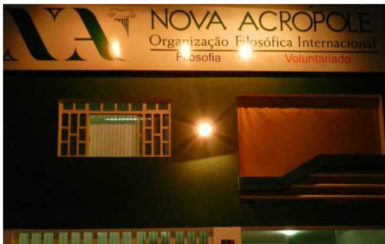
A Nova Acrópole Guará fica na QE 24 conjunto A Casa 06, em frente à Estação Guará do Metrô. Contato pelos telefones 3567-5024 ou 9237-6087

A comemoração será na sede de Nova Acrópole, localizada no Lago Norte onde serão concentradas todas as escolas de filosofia de Brasília. O visitante também poderá prestigiar a exposição no Park Shopping entre os dias 10 e 18 de novembro e participar da