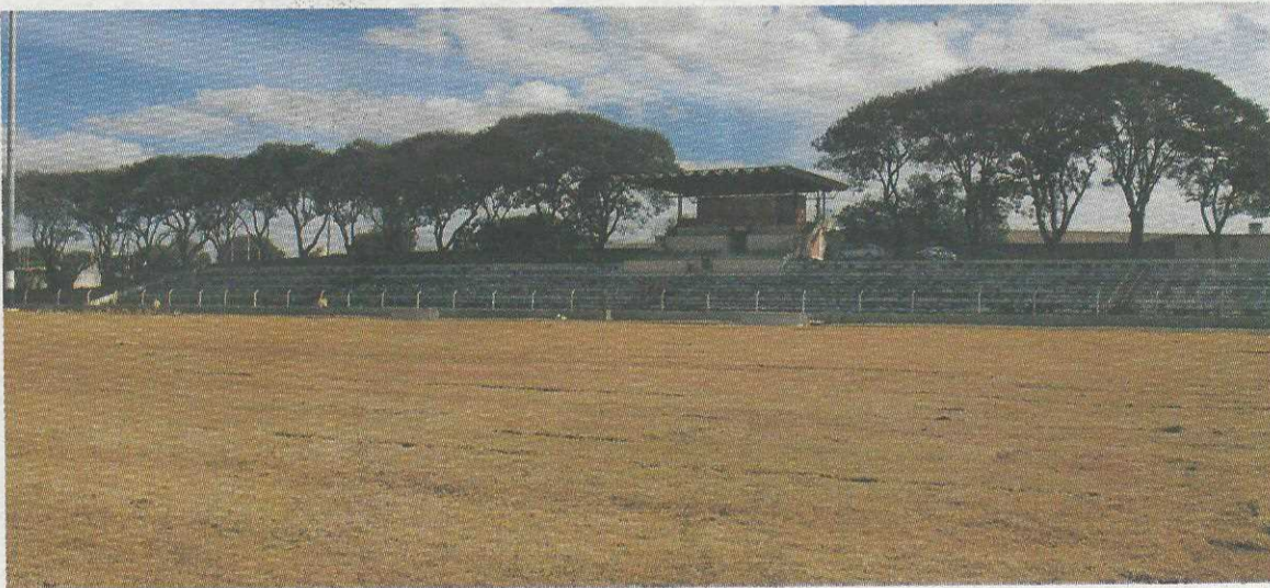
Novo gramado do Cave será um dos dois melhores do DF

O reformado estádio somente será utilizado pelo futebol local a partir de 2016, a partir de janeiro se o Clube de Regatas Guará, que disputa a segunda divisão em andamento conseguir uma das duas vagas para a primeira divisão, ou se o estádio for requisitado para o mando de jogos de outros times, o que deve acontecer por causa de sua privilegiada localização e o novo gramado. O CR Guará deve ser um dos interessados na gestão do Cave depois que foi arrendado pelo ex-presidente da Federação Brasileira de Futebol e um dos idealizadores do estádio Mané Garrincha, Fábio Simão. O outro clube de futebol profissional, o Capital, licenciou-se e não está disputando a segunda divisão deste ano.