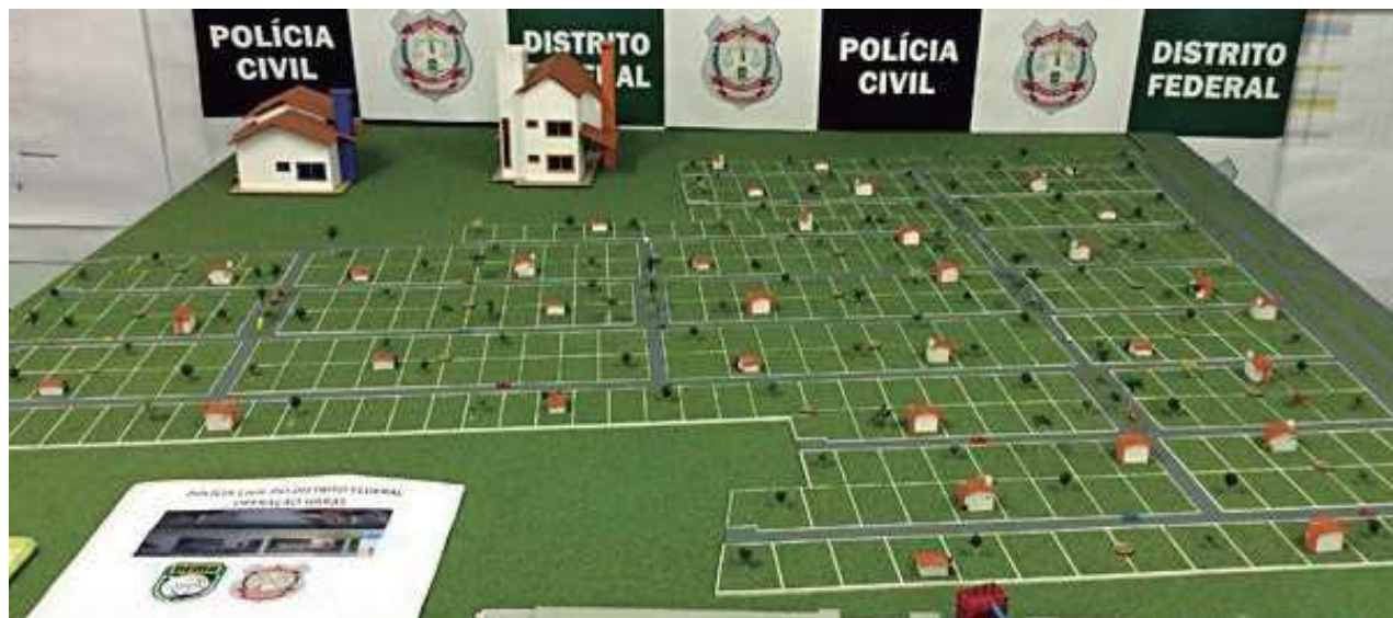
A maquete apreendida na sede da associação mostrava os mais de 300 lotes residenciais à venda na área da Terracap. Pelo menos 100 há estavam vendidos.

Os falsários foram presos pela Polícia Civil na tarde da última terça-feira (13) em um escritório em Taguatinga. A polícia encontrou uma grande quantidade de cheques de ví-