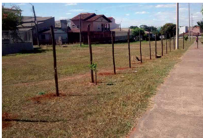
Cercamento da área para obra já começou

No caso do Ensino Médio ou Ensino Médio Integrado à Educação Profissional (profissionalizante), o estudante precisa ter concluído o Ensino Fundamental. Para o Ensino Técnico subsequente, o aluno tem que ter concluído o Ensino Médio.