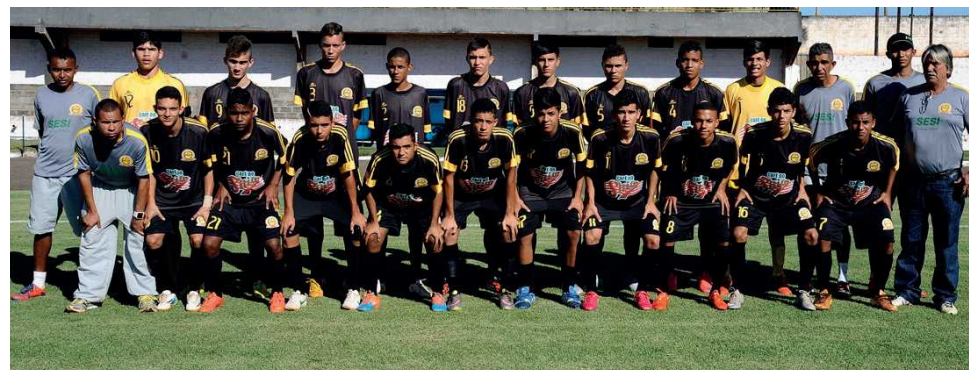
Time juvenil ficou com o vice-campeonato, mas mostrou revelações que interessam a clubes profissionais de outros estados

Além de João Victor, o clube gaúcho pode levar mais outras duas revelações do time guaraense, que se destacaram durante o torneio.