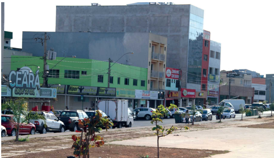
O adensamento populacional do Polo de Moda e QE 40 sem planejamento é uma das principais causas da violência. Sem estacionamentos, os carros ficam nas ruas, e os baixos preços dos aluguéis são um chamariz para os criminosos

Como são irregularidades e pequenas, as quitinetes atraem o inquilino de menor poder aquisitivo e, pior, sem necessidade de comprovação de antecedentes criminais ou de cadastro. "É pra lá que vão as pessoas que não conseguem alugar em outro lugar por causa das exigências de documentos ou de ficha limpa, ou que pretendem ficar por pouco tempo em um lugar enquanto praticam crimes", teoriza o delegado chefe da