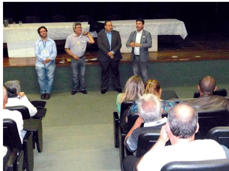
Cerca de trinta pessoas participaram da reunião com os técnicos da Secretaria de Relações Institucionais