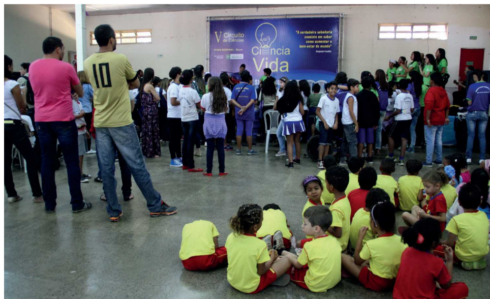
Além dos projetos científicos, os alunos apresentaram performances artísticas aos colegas e professores