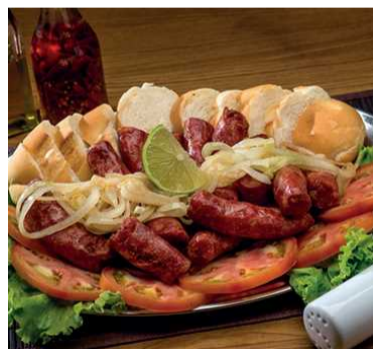
Linguiça de Formiga

A promoção da vez para o mês de setembro - carne de sol com mandioca e manteiga de garrafa (R$ 38,90), cervejas Skol e Antarctica (R$ 5,50) e caipirinha (R$ 6,90).