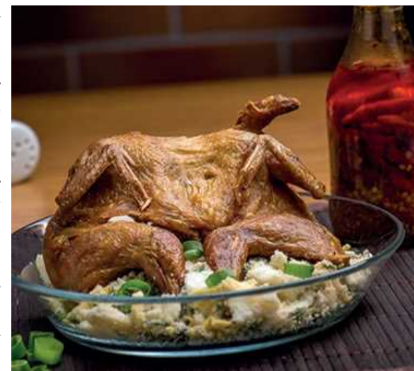
A tradicional codorna frita com farofa de ovo