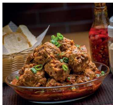
Pescoço de peru