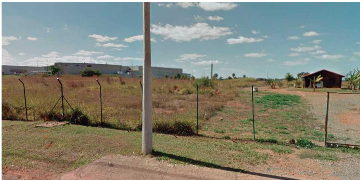
O projeto prevê a construção de 17 edifícios residenciais e quatro comerciais ao lado do ParkShopping. Terrenos podem render até R$ 400 milhões ao governo

A cobiça pelo terreno é antiga. Antes, os governos petistas de Cristovam Buarque e depois de Agnelo Queiroz tentaram fazer a mesma coisa, mas esbarraram em ações do Ministério Público. Tudo começou no Governo Cristovam, quando a área foi repassada a um amigo do ex-presidente Lula, dono de uma grande empresa de informática, para a insta-