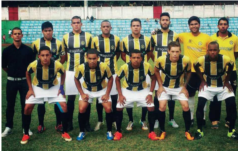
Time foi mesclado com jovens e veteranos do futebol brasileiro, mas a mistura não rendeu o resultado esperado

CR Guará e Capital frustraram os torcedores da cidade. Guará fez campanha melhor, mas não conseguiu se classificar