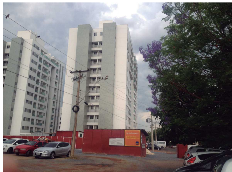
Os prédios do Guará que serão entregues em breve e as casas recém-construídas conseguirão a Carta de Habite-se com mais agilidade. A burocracia para a emissão do documento é uma das principais causas de atraso na entrega de imóveis

O projeto de lei altera o estabelecido no Decreto nº 33.740, de 28 de junho de 2012, que instituiu a obrigatoriedade da apresentação do RIT pelos empreendedores. Pela nova proposta, o governo é quem planejará e executará, com os recursos dessa contrapartida e por meio da Secretaria de Mobilidade, as medidas mitigadoras e