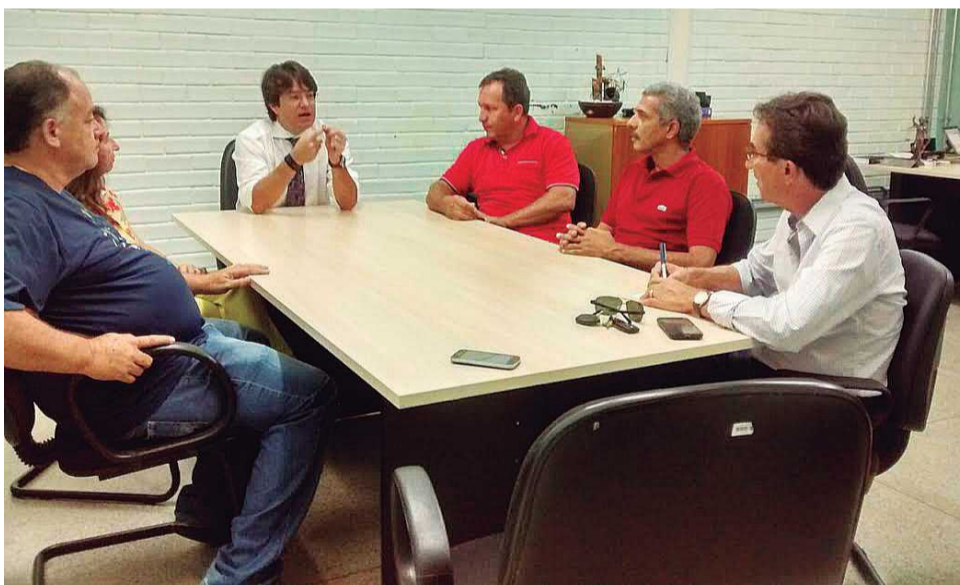
Lideranças comunitárias tem prestado solidariedade ao delegado

Para o delegado, a polícia está "enxugando gelo", ao juntar todas as evidências possíveis do crime, como fotos, filmagens, recolhimento da droga e prisão em flagrante e mesmo assim a Justiça entende que não há motivos para a continuidade da prisão. "O tráfico de drogas é considerado um crime hediondo e mesmo assim nem a fiança foi cobrada, porque o juiz en-