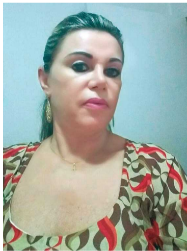
A ex-diretora do CEF 10 critica as alterações sobre o projeto original, criado por ela

“Não podemos permitir o fim da escola integral no Guará, mas não dá para continuar na estrutura existente. Vamos nos mobilizar e cobrar uma posição da Secretaria de Educação, porque a educação integral é uma promessa