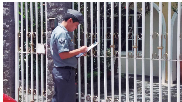
Forças Armadas foram convocadas em todo o país para participar da luta contra a epidemia

Segundo a Agefis, quando constatado um aglomerado de entulho que possa contribuir para a formação de criadouros, a agência identifica o responsável e dá até cinco dias de prazo para o recolhimento do material. Caso não seja cumprido, a multa aplicada pode variar de R$ 74 a R$ 185 mil, dependendo da quantidade, do local de descarte e do tipo de lixo