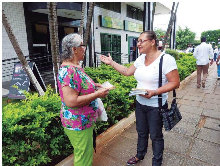
Servidores da Administração participaram da mobilização