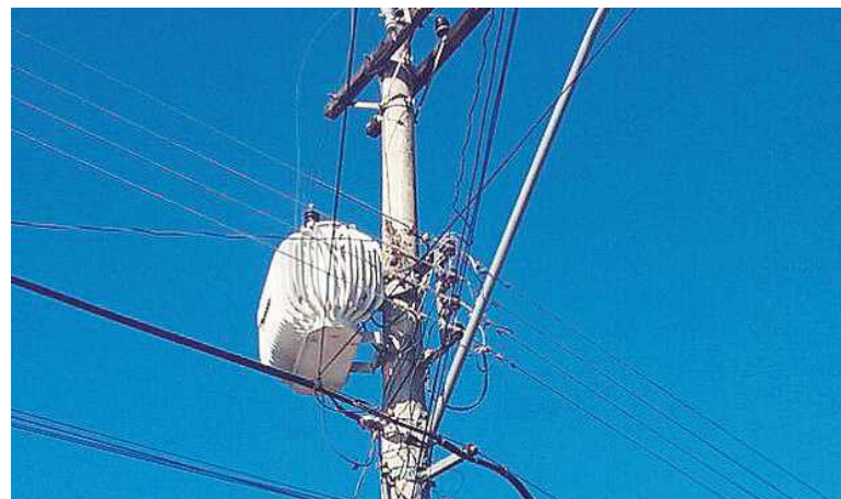
Três cães mortos pelas abelhas instaladas no poste há dois anos