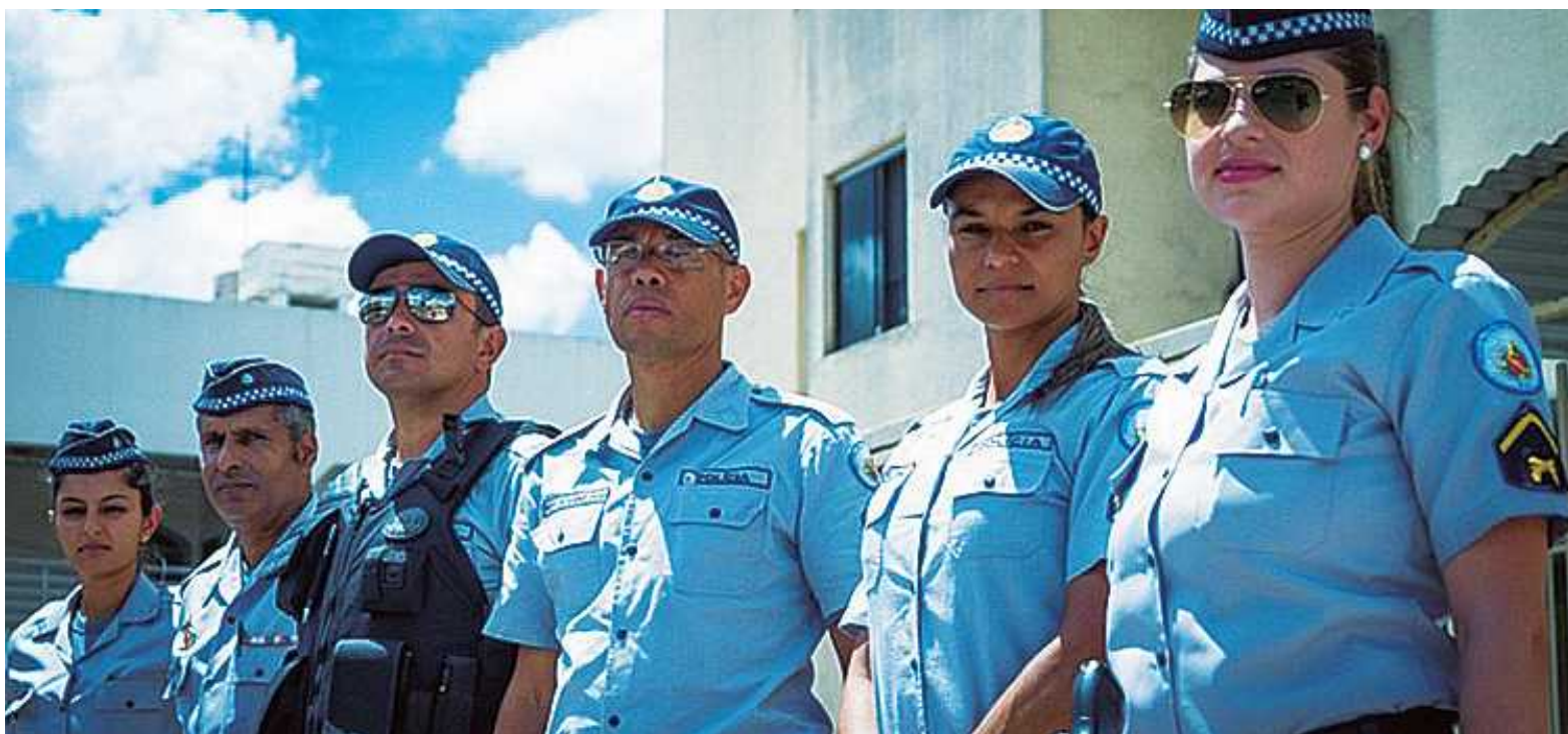
Equipe responsável pelo projeto no Guará

Todos os casos são arquivados pela PM em pastas coloridas. Cada cor aponta o grau de vulnerabilidade das famílias que estão sendo acompanhadas. A vermelha corresponde a um cuidado especial das equipes. “São casos mais graves, nos quais pode haver violência no seio familiar. Com a ajuda do Ministério Público, podemos encaminhar a vítima para uma casa abrigo e afastar o agressor do convívio familiar.