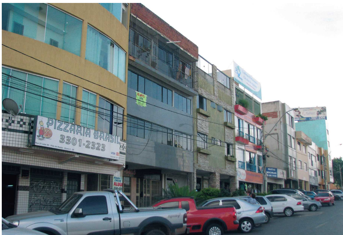
A regularização da QE 40/Polo de Moda deverá considerar a situação atual da quadra, desvirtuada do seu projeto original. Uma das soluções estudadas é cobrar o valor cheio de quem apenas especula

“Se já está ruim para vender, imagine levarem o resultado do que o comerciante consegue vender”, reclama. A solução está sendo buscada em parceria com as áreas de segurança da cidade. “Com a ajuda do 4º Batalhão da Polícia Militar e da 4ª Delegacia de Polícia, estamos criando meios de proteger um pouco mais o empresário”, conta. Um desses meios é a divulgação e implantação do Sistema de Monitoramento e Acionamento Policial Imediato, o Smapi, um sistema eletrônico que pode ser acionado instantaneamente pelo lojista ao 4º Batalhão da PM.