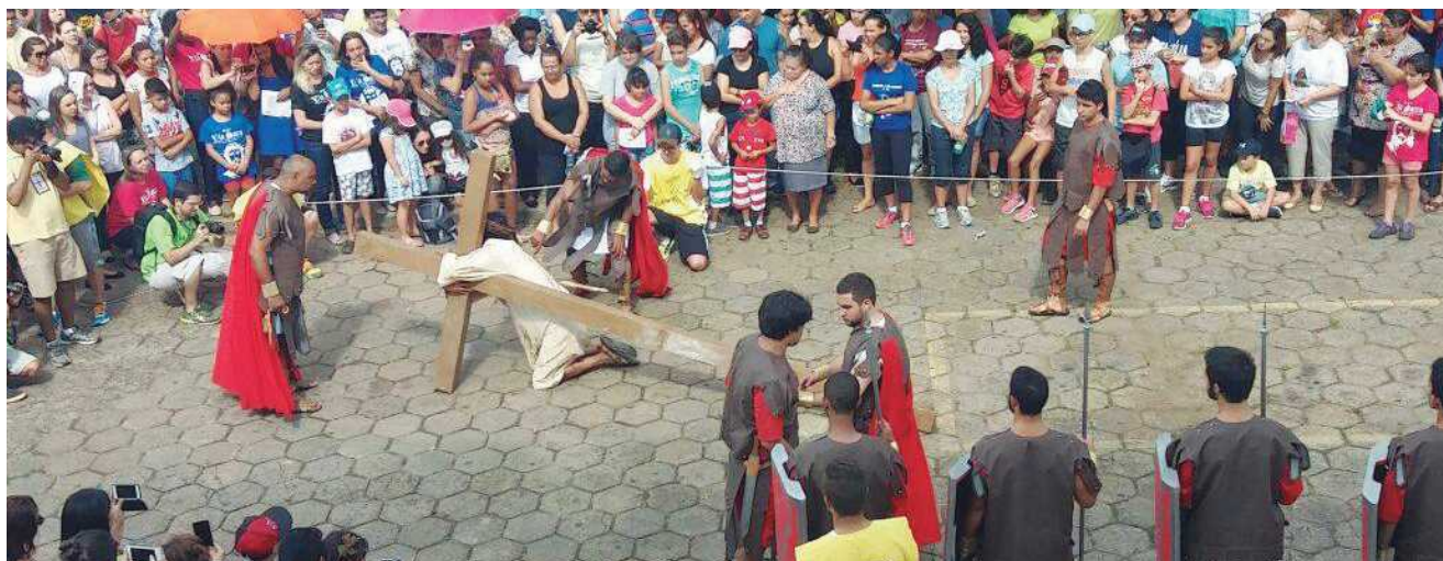
Via Sacra da Paróquia Maria Imaculada atraiu mais de 3 mil pessoas às ruas do Guará para acompanhar a Paixão de Cristo

As pessoas andam muito estressadas. Seja no trânsito, na política ou no dia a dia a gente percebe muito claramente essas coisas. A crise financeira e os problemas particulares agravam este nervosismo que provoca mais doenças e desavenças, que às vezes criam inimizades que podem destruir relações entre as pessoas. É preciso calma e reflexão, combata este estado de coisas para que você não se torne vítima da sua própria raiva. Assim como o bem se reproduz, o mal também pode se reproduzir. "Keep Calm and Carry On". Nessa vida tudo passa, as coisas boas e as coisas ruins. Você é mais importante do que os seus problemas.