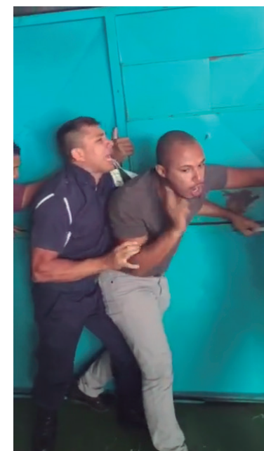
Sequência de imagens mostra pessoas gritando com os seguranças e um homem invadindo a emergência do hospital e sendo contido: desespero pela demora no atendimento