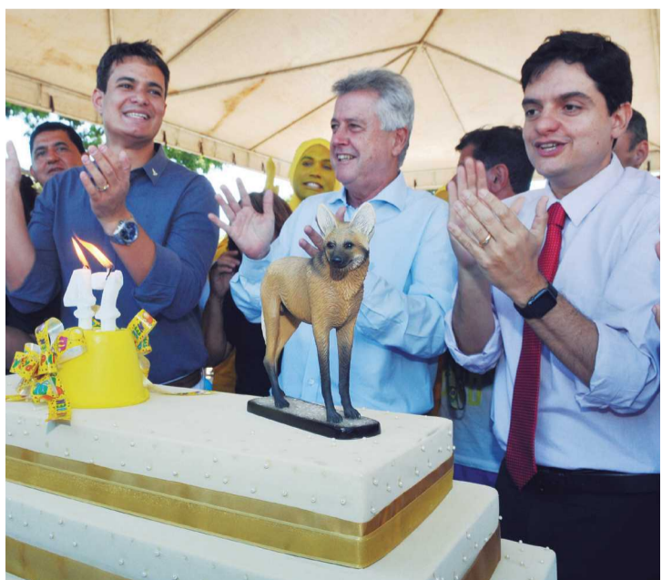
Administrador André Brandão, governador Rofrigo Rollemberg e o deputado Rodrigo Delmasso durante a festa

O Departamento de Trânsito (Detran) também participou da festividade com um estande para divulgar a campanha Maio Amarelo. Para conscientização de motoristas e pedestres, foram distribuídos material informativo e promovidas atividades educativas.