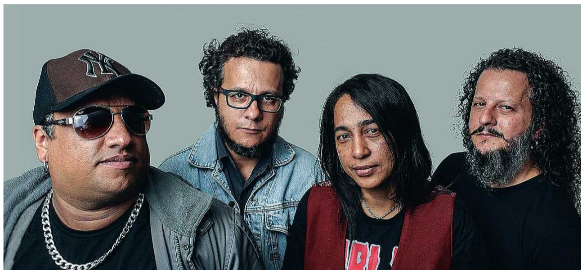
A banda guaraense Dog Savana se apresenta no sábado

Os quiosques externos da Feira do Guará serão tomados neste final de semana por atrações musicais. Enquanto bandas se revezam no Arco da Cultura, dezenas de colecionadores de discos de vinil expõem suas preciosidades. A partir de 10h, tanto no sábado quanto no domingo, o público poderá conhecer bandas da cidade e de outras regiões do DF, além de comprar ou trocar discos long-play.