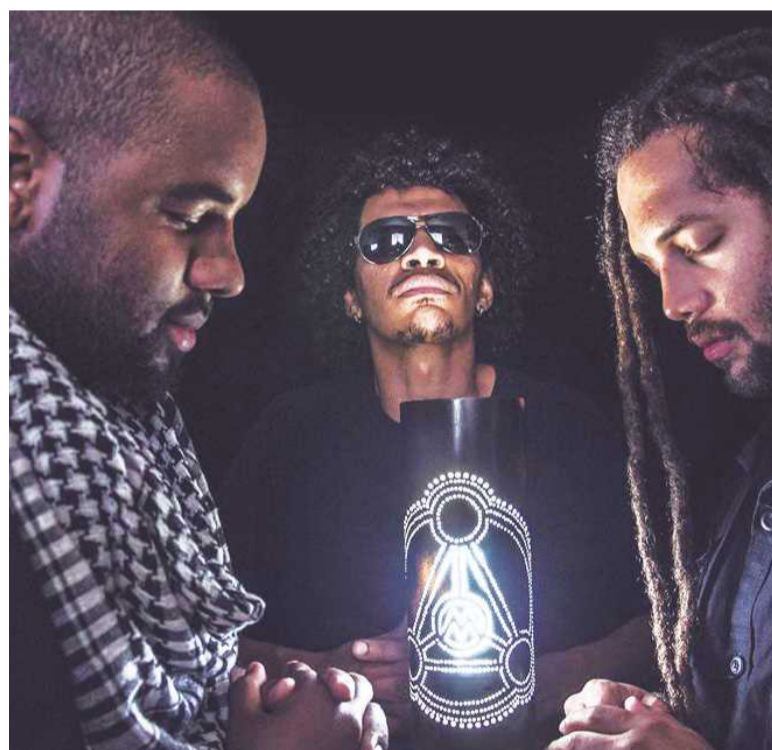
Com temática ufológica, a Movni representa o rap na Feira da Música

Apresentam-se no sábado as bandas lokinha Rappers, Caoxa de Pandora, Ras kakaroto, Dog Savana, Corte Seco e Virada Cuca. No domingo é a vez de Cerrado Youth, MOVNI, Mc Dejah, My Last Bike, Blasterror, Cartel Sonoro, Profans, HNG e De-sonra. A produção é de Ricardo Retz, do Museu da Música de Brasília. Os shows se encerram às 18h, quando os colecionadores assumem as pickups e tocam até o fim da noite nos quiosques em frente à feira. A entrada é gratuita.