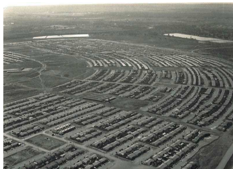
Guará II foi criado para abrigar servidores federais

Com a cidade concretizada e em franco desenvolvimento, o governador José Ornellas, em 1985, último ano de seu governo, criou a QE 38 para assentar 523 famílias que viviam na Vila da CEB, Vila União, Vila Socó e Guarazinho. No processo de assentamento, pessoas de todo o DF aproveitaram para se instalar na nova quadra, como as fa-