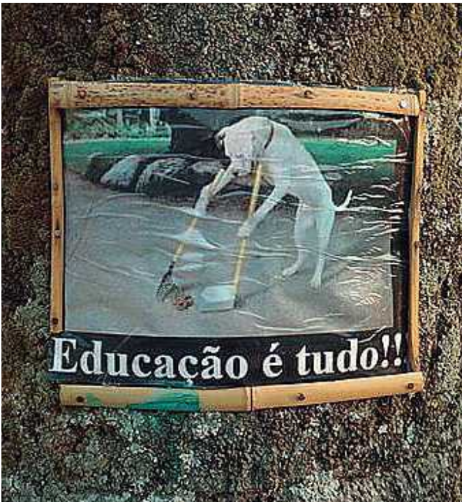
Imagem da semana na rede social "Nós que amamos o Guará". Não vai demorar muito e seremos impedidos de andar na rua. O único erro do protesto, feito por um morador não identificado, foi ter pregado a placa em uma árvore. Educação é tudo!

Este colunista considera que caso a alteração seja concretizada e a área seja entregue ao setor imobiliário, o Parque Ecológico Ezechias Heringer corre um risco iminente de ser destruído. O Projeto de Lei que altera a área do parque está na pauta e pode ir para votação na próxima terça-feira, dia 27 de setembro.