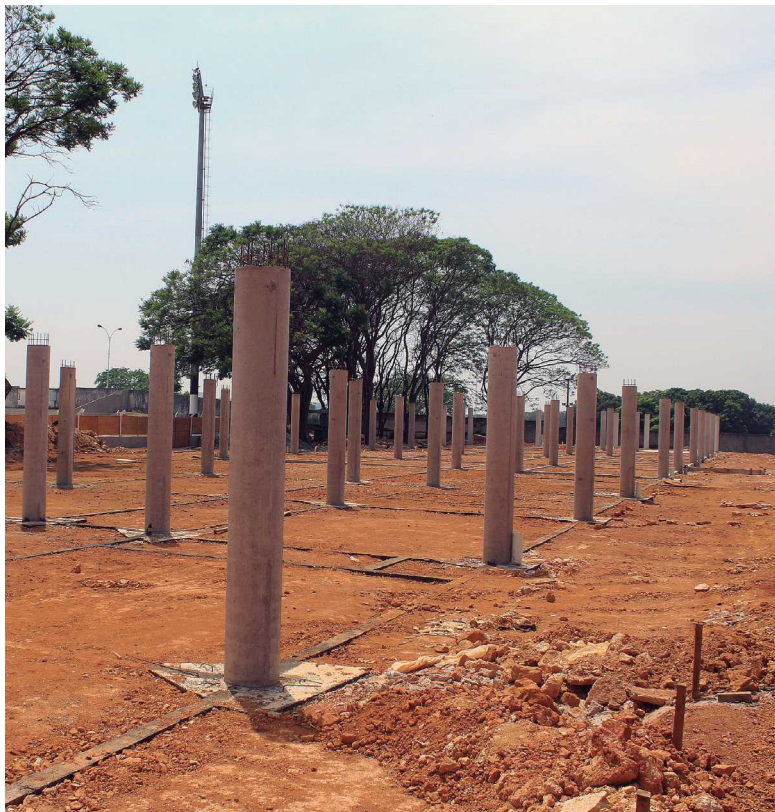
O gramado (acima) está pronto. Estrutura para receber os vestiários também