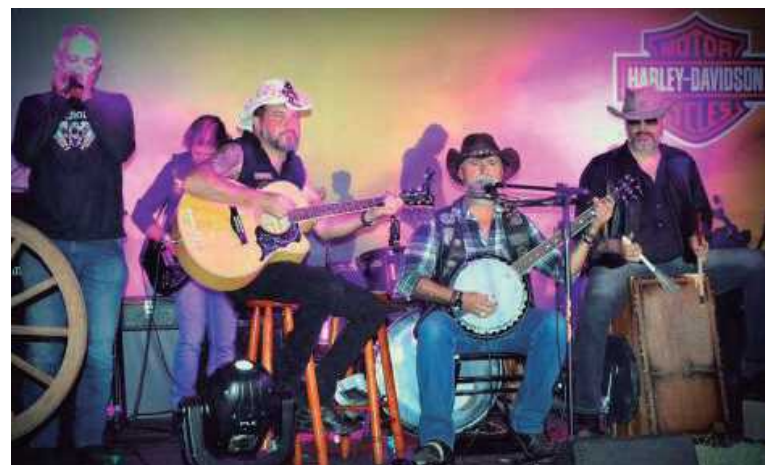
A banda Cerrado Kentucky toca no Polo de Moda. Chapéus, como o do modelo acima, serão distribuídos para os primeiros que chegarem à praça da QE 17

"O Samba do Banquinho tem como característica principal ser uma roda de samba democrática, onde todos podem trazer seu instrumento e principalmente seu banquinho e tocar sem ser incomodado. Outra caracte-