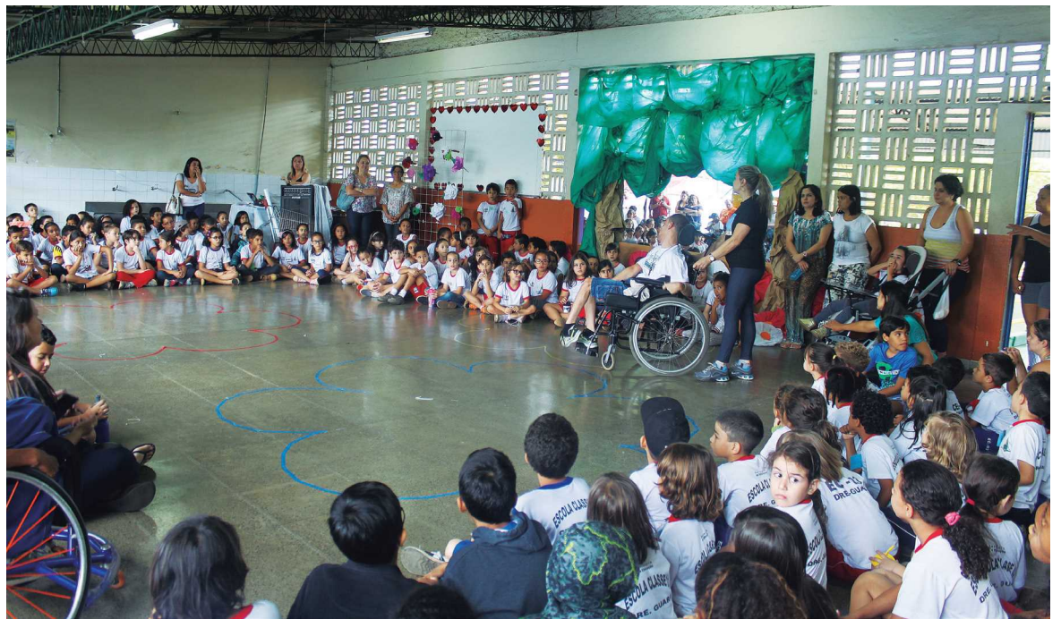
Alunos das Escolas Classes 3 e 5 do Guará interagem com os alunos do Centro de Ensino Especial

Os números da bilheteria também impressionam: foram vendidos 2,1 milhões de ingressos no total, segunda maior venda da história da Paralimpíada, mostrando o interesse do brasileiro pela diversidade e inclusão por meio do esporte. Na quadra do Centro de Ensino Especial