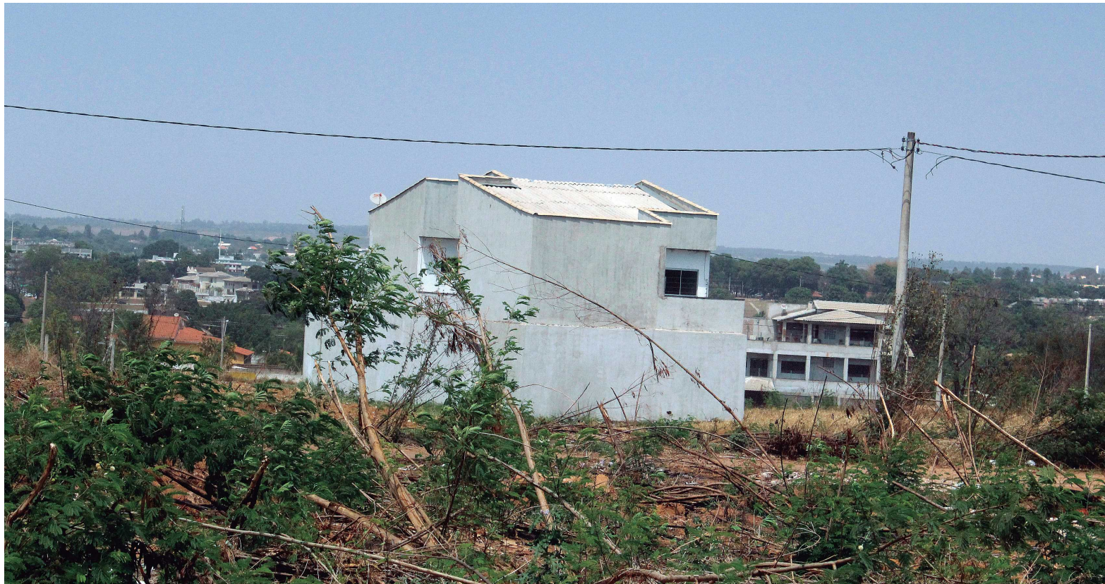
A expansão do Guará, conhecida como Cidade do Servidor, já está liberada para construção

A venda dos lotes na Expansão começou em 2010, mas foi interrompida em 2011, quando o Plano Diretor Local (PDL), que definia os parâmetros de ocupação da cidade, foi considerado inconstitucional por "vício de iniciativa", ou seja, continha alterações de iniciativa de deputados distritais, o que não é permitido pela Lei Orgânica do DF. A venda foi retomada em maio deste ano, depois que foi aprovada a lei que estabelece novos parâmetros para as construções na região do Guará.