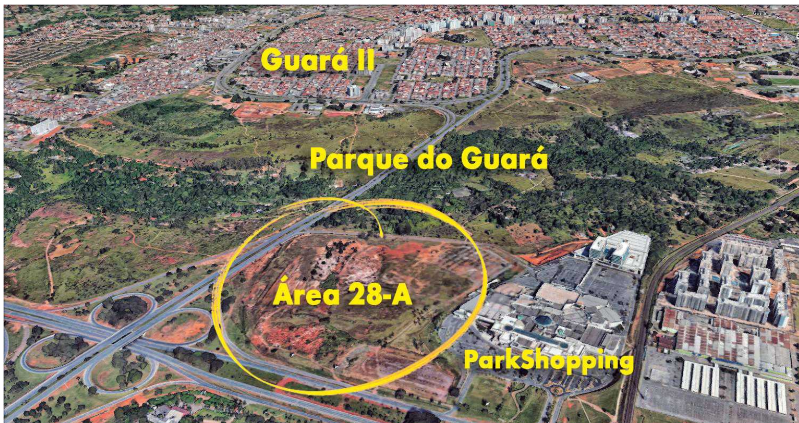
Terreno de 18 hectares está avaliado entre R$ 300 e 400 milhões, mas lideranças do Guarará acham que vale bem mais

O relator da matéria, deputado Robério Negreiros (PSDB), explicou que a alteração retira do parque a Área 28-A, "por considerar que esta área não possui atributos ambientais para integrar o parque". O relator acrescentou que a modificação proposta também corrige um "erro", pois o terreno total do parque