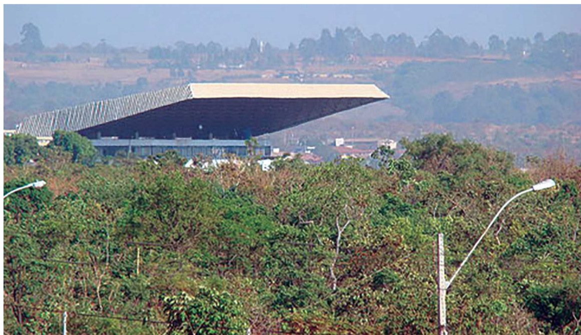
Desde a desativação da pista de equitação há mais de 20 anos a área nobre é disputada. Plano de Ocupação foi apresentado em 2008 e prevê 16 quadras residenciais e 13 comerciais

A área no Noroeste inclui quatro lotes comerciais no valor de R$ 24,49 milhões. A de Águas Claras é um terreno de R$ 21,6 milhões. Já a do Jóquei Club é uma gleba de R$ 147 milhões. A soma dos três imóveis equivale a R$ 193,09 milhões. O valor final de todos os imóveis que serão incorpo-