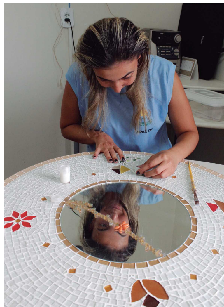
Além de se sentirem úteis, eles ainda conseguem uma "graninha" na venda de produtos artesanais

QE 38 CONJ. L LOTE 38 LOJA 01 - GUARÁ II 3047 5702 3042 9164