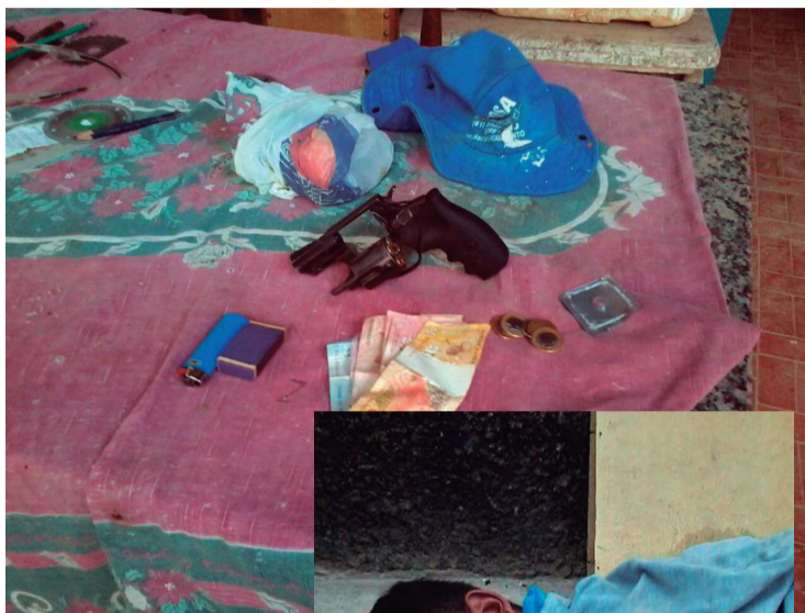
Os assaltantes foram imobilizados e entregues à polícia