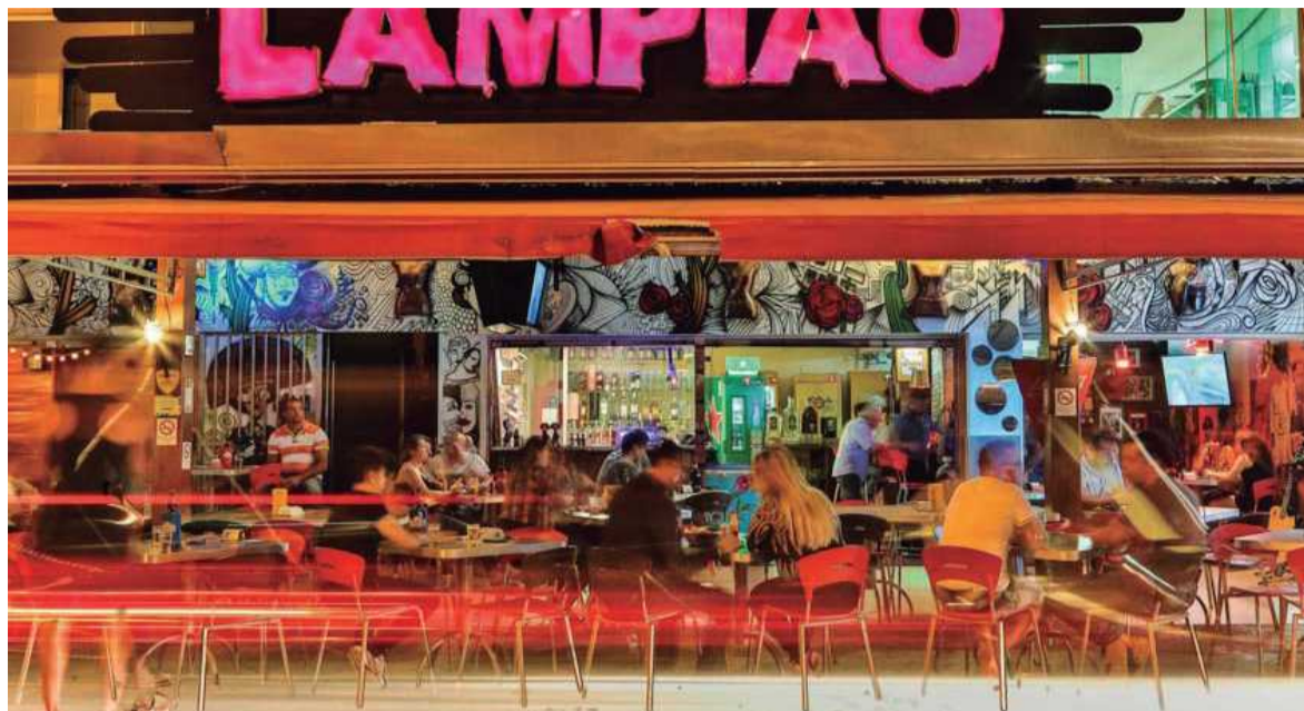
O Lampião, no Polo de Moda, é um dos bares mais movimentados da cidade

Entre frutos do mar, petiscos e pastéis, o local é opção para grupos grandes de