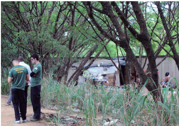
Além das chácaras, novos invasores, em barracos e casebres improvisados ocupam o Parque do Guará

Segundo a presidente do Ibram, assim que for concluída