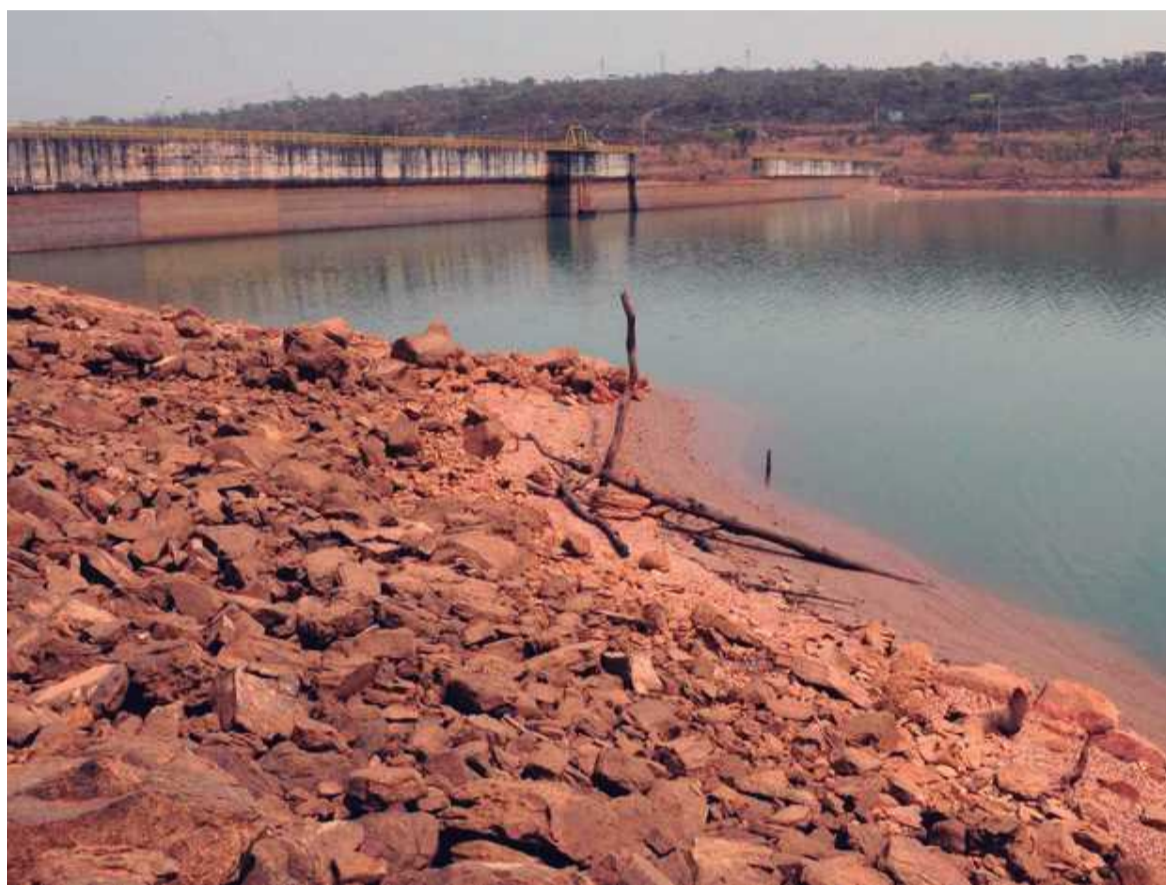
Como não choveu o esperado para janeiro, a Barragem do Descoberto não terá água suficiente para abastecer as cidades no período de seca

Em novembro, o governo de Brasília deu início às obras da represa do Bananal. A novidade vai custar aos cofres públicos cerca de R$ 20 milhões e deve ficar pronta em um ano. O Bananal levará água para moradores do Plano Piloto, do Cruzeiro e do Lago Norte — 170 mil ao todo. Com capacidade de vazão de 726 litros por segundo, a bacia desafogará o reservatório de Santa Maria, responsável pelo abastecimento dessas três regiões administrativas. É a primeira grande obra para