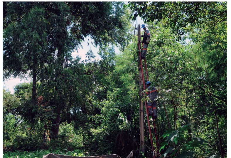
Cercas, ligações elétricas e ligações hidráulicas clandestinas também são alvo da operação na área de preservação

a desocupação, haverá mutirão de limpeza, avaliação de danos, e o plano de manejo será refeito.