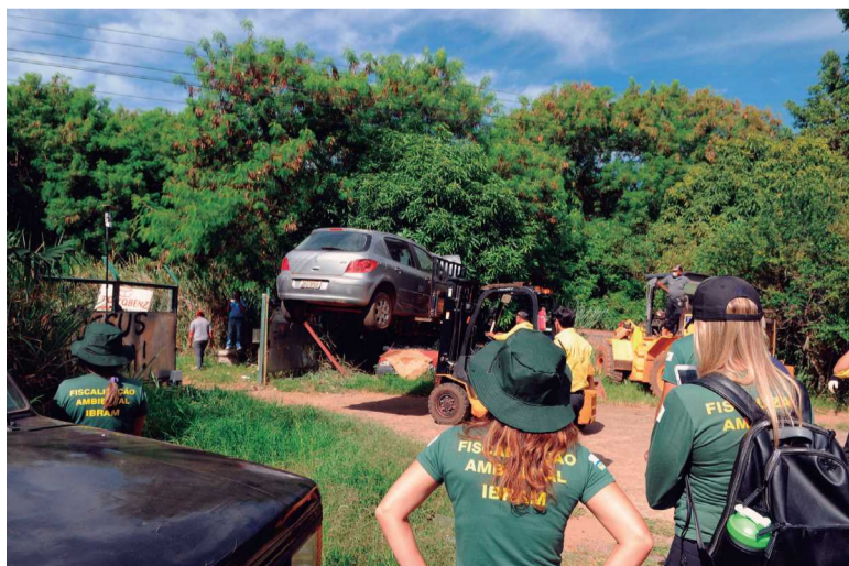
Equipamentos para retirada de veculos e animais esto  disposio das equipes: cuidado para causar menor possvel impacto ao meio ambiente

da operao da desocupaco. “A operao desde o seu incio tem alcanado o xito pretendido. As pessoas que ali esto j haviam sido notificadas, portanto, j possum cincia do que ocorreria, mesmo porque elas j sabiam que ocupavam rea de extrema relevncia ambiental. Em uma simples consulta  Internet, qualquer cidado pode ter conhecimento que essas pessoas que habitavam irregularmente o parque ecolgico Ezechias Heringer j haviam sido notificadas em 2014. Alguns desses irregulares at concordam em sair.  claro que existem aqueles que no concordam e  legtimo que busquem seus direitos, no entanto, a preservao do parque  prioridade e essas pessoas no podem ficar l. Eu acredito que a interrupo das derru-