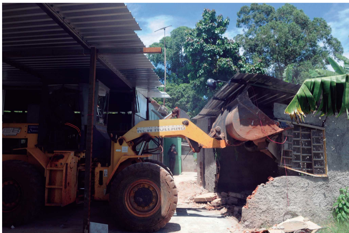
Empresas, como oficinas e igrejas, foram retiradas logo nos primeiros dias de operao

A diretora-presidente da Agefis disse que, para garantir a preservao da rea, a desocupaco  orientada pelo Instituto Braslia Ambiental