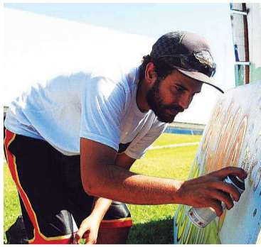
Microfone é um grafiteiro mais conhecidos da cidade

Aqui no Guará, é possível encontrar a arte em vários espaços públicos da nossa cidade, como praças, muros e bancos. Existe a intenção de interferir na paisagem da cidade, transmitindo diferentes ideias e valores. E, agora, você pode não só admirar o grafite, como também aprender as técnicas deste, por meio de uma oficina realizada pelo grupo "Sem Vergonha Crew".