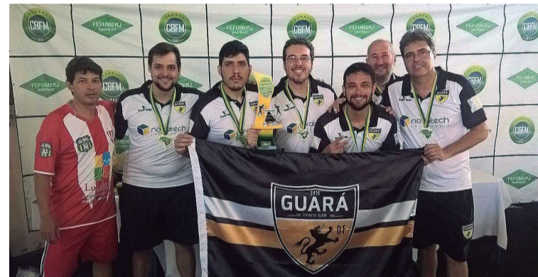
Equipe do GEC que foi uma das surpresas do campeonato

da AABB de Brasília, que recebeu o prêmio de melhor equipe fora do Rio de Janeiro, terminando a competição na quarta colocação na categoria Prata. Mas, a colocação do Guará é que mais surpreendeu os organizadores e competidores, porque foi a estréia do representante guaraense no campeonato.