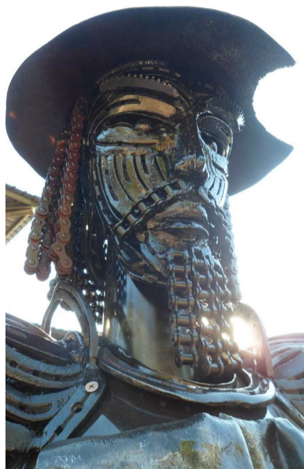
Guará terá direito a levar oito artesãos da cidade para exporem os seus trabalhos. Inscrições poderão ser feitas até o dia 14 de março

A Administração Regional do Guará, em parceria com a Secretaria de Estado do Esporte, Turismo e Lazer, publica edital para o processo de seleção de artesãos interessados em participar do 9º Salão do Artesanato - Raízes Brasileiras, que acontecerá no período de 29 de março a 2 de abril 2017, no Pavilhão de Exposições do Parque da Cidade. As inscrições poderão ser realizadas por meio de formulário eletrônico disponível no site da Administração Regional do Guará - www.guara.df.gov.br . O edital também está disponível no mesmo endereço.