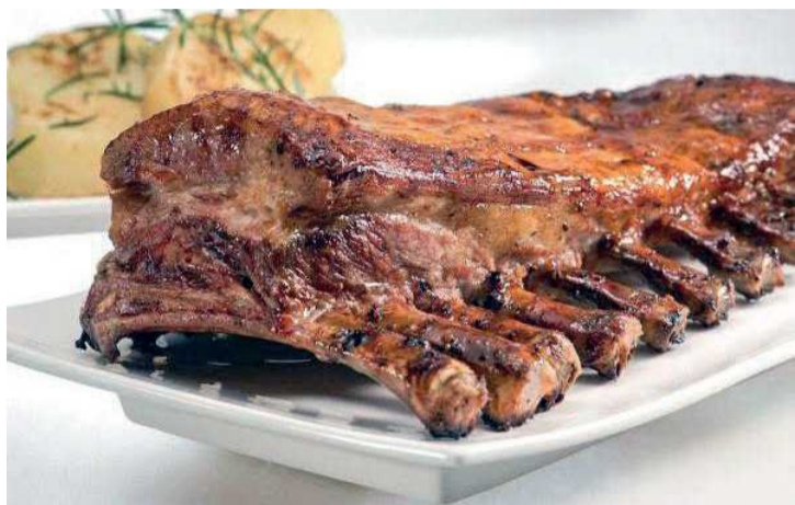
A costelinha suína do Ribs On The Truck é uma das atrações do evento

Melhores restaurantes sobre rodas de Brasília estacionam no Teatro de Arena no sábado