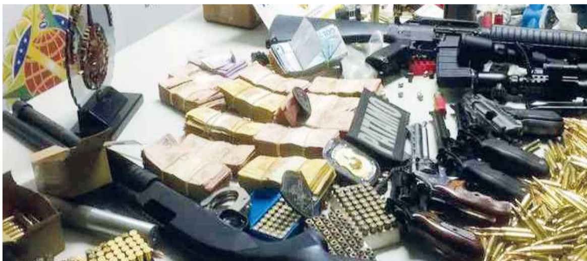
Os irmãos tinham farta e potente munição e R$ 40 mil em espécie dentro da loja na QE 7

Após o assalto, e serem perseguidos por uma outra equipe da polícia, os ladrões jogaram um balde cheio de pregos retorcidos, conhecidos como "miguelitos", na pista para tentar furar os pneus das viaturas. Obrigados a parar, os policiais recolheram os baldes