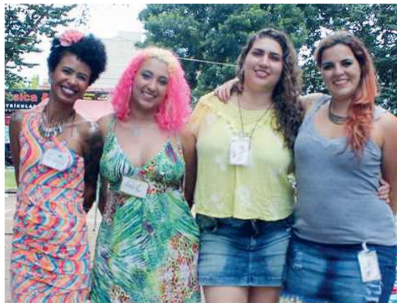
De acordo com as organizadoras da feira, a essência é aprender a consumir de forma responsável e sustentável

Após circular o DF em 2016, feira de trocas Bazar das Meninas retorna ao Guará