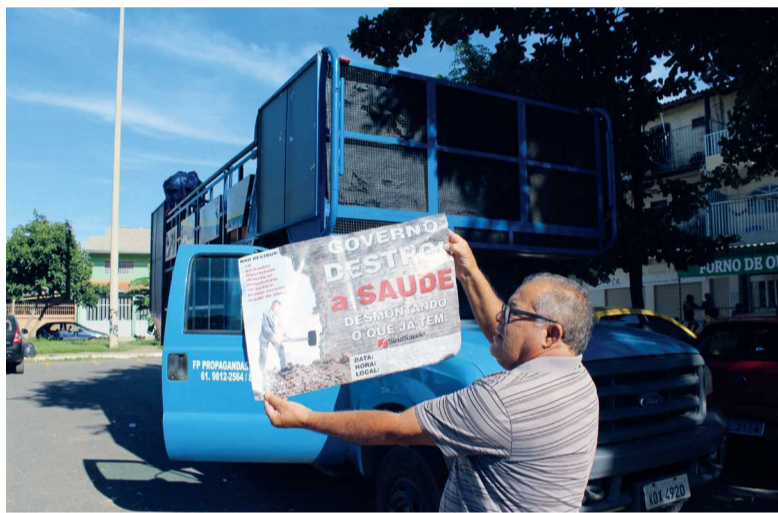
Cartazes impressos por opositores às mudanças na Atenção Básica à Saúde e abaixo-assinados circularam durante as duas últimas semanas nas proximidades e nas próprias dependências dos postos de saúde

Essa conversão no modelo de atuação coloca em evidência a Atenção Primária, que é responsável pela prevenção de doenças e acompanhamento de saúde da população. Estima-se que, no Distrito Federal, cerca de 70% dos atendimentos realizados nas emergências dos hospitais regionais podem ser direcionados às unidades básicas.