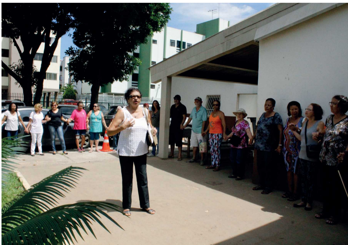
Moradores se reuniram em frente ao Posto de Saúde do Lúcio Costa em protesto contra o fechamento

O movimento conta com a ajuda de grupos políticos que fazem oposição ao governo de Rodrigo Rollemberg que, para desestabilizar o programa Saúde na Família e a própria política de reestruturação da Secretaria de Saúde, tem usado carros de som, cartazes, panfletos e outros recursos para espalhar a informação que os postos serão fechados ou deixarão de atender o cidadão, o que nega o coordenador de