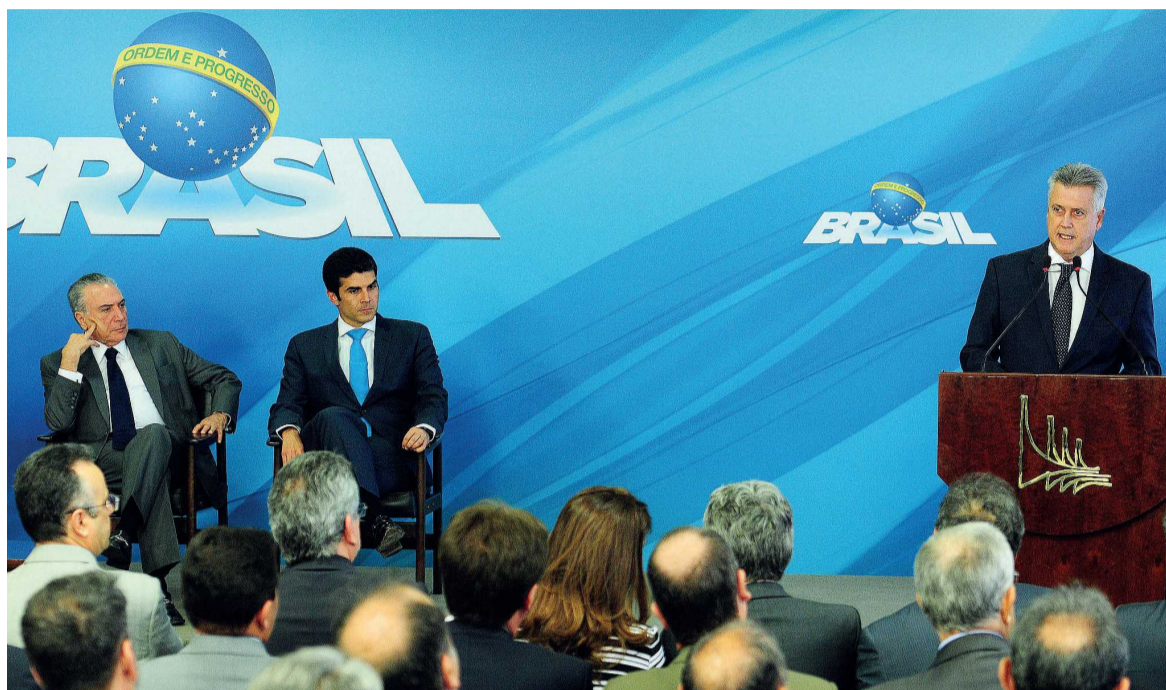
O governo federal liberou R$ 55 milhões para iniciar as obras de captação emergencial de água do Lago Paranoá. A cerimônia de transferência do recurso ocorreu na tarde desta quarta-feira (15 de março), no Palácio do Planalto, com a presença do presidente da República, Michel Temer, do ministro da Integração Nacional, Helder Barbalho, e do governador Rodrigo Rollemberg.

A intervenção consiste em instalar uma estrutura flutuante no lado norte do lago. Ela vai distribuir até