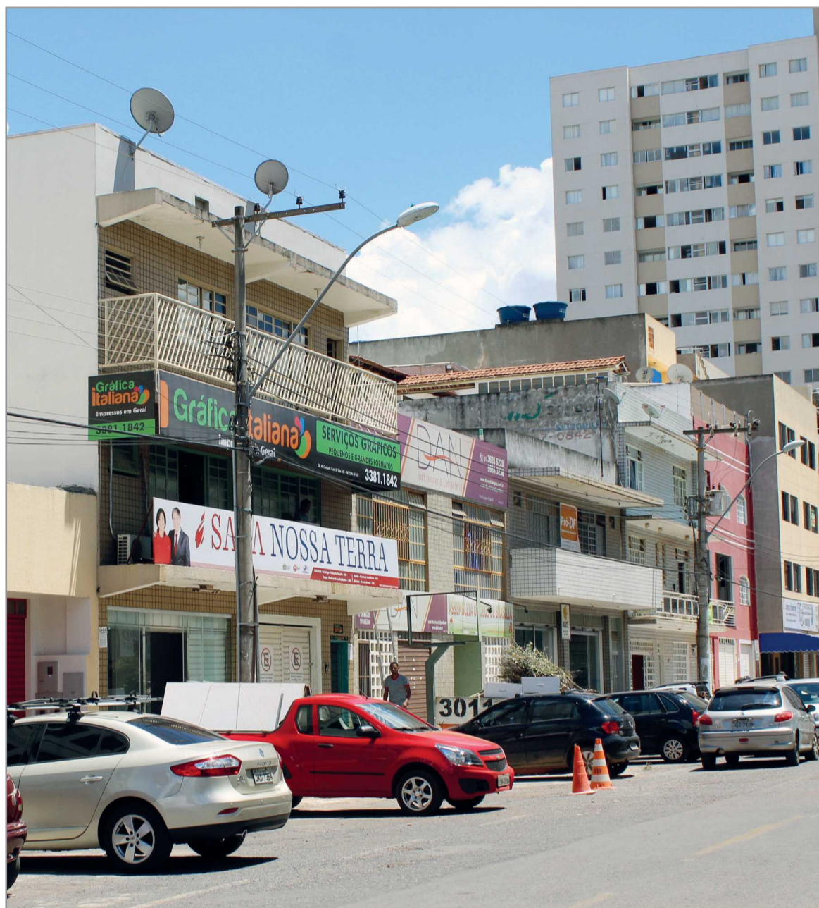
Cerca de 260 lotes na QE 40 ainda não foram regularizados por causa de pendências. Nova oportunidade abranda exigências para facilitar a regularização

O governo deixa claro, entretanto, que ainda não está regularizando os projetos pendentes, mas dando a eles a oportunidade de re-