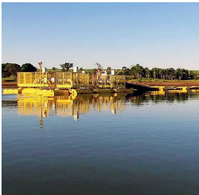
Captação de água no lago Paranoá será através de uma balsa. A água será tratada à beira do Lago por meio de uma Estação de Tratamento Compacta, a ser instalada. Depois de tratada, a água será enviada para abastecimento do Lago Norte, Varjão, Setor de Mansões do Lago Norte, Taquari, Paranoá e Itapoã.

São elas Guará I e II, Lucio Costa, Colônia Agrícola Águas Claras, Quadras de 1 a 5 do Setor de Mansões Park Way, Candangolândia, Núcleo Bandeirante e algumas quadras de Águas Claras.