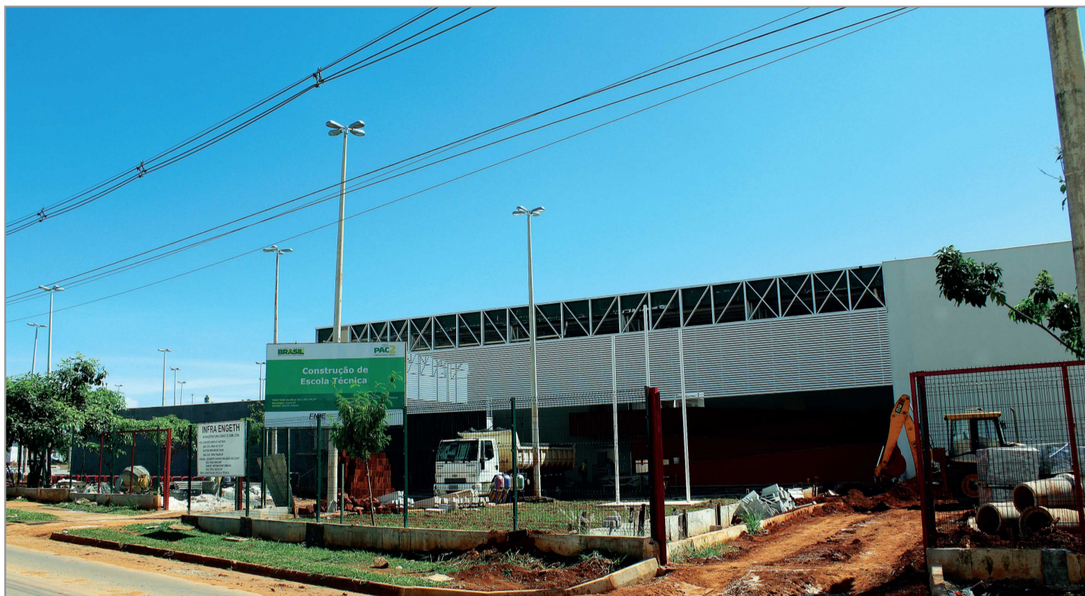
Obras estão cerca de 90% concluídas e o prédio deve ser entregue até o final de abril

Os critérios para a ocupação das vagas já foram definidos pelo Grupo Técnico de Trabalho do Cepag, formado por representantes da comunidade escolar e dos moradores, e serão destinadas preferen-