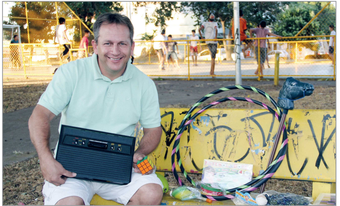
A maioria dos eventos culturais da cidade passa por ele. O São João, Lazer das Antigas e o Carnaguará são alguns