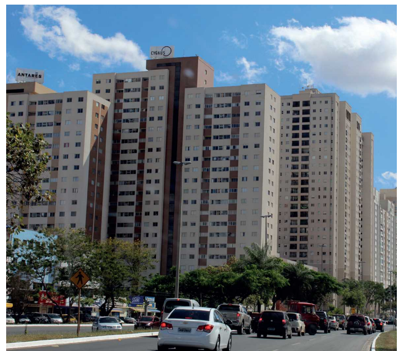
A altura máxima dos prédios do Guar fica definida em 12 andares, 6 para as áreas internas da cidade

reportados por moradores que vivem próximos a comércios instalados em áreas indevidas. A Luos, se aprovada como proposta atualmente, prevê que os lotes voltados para a avenida central do Guar II, e parte dos lotes na avenida central do Guar I, poderão receber comércios. O mesmo vale para os lotes de esquina voltados para a rua de acesso de todas as quadras residenciais. Curiosamente, em torno das praças os