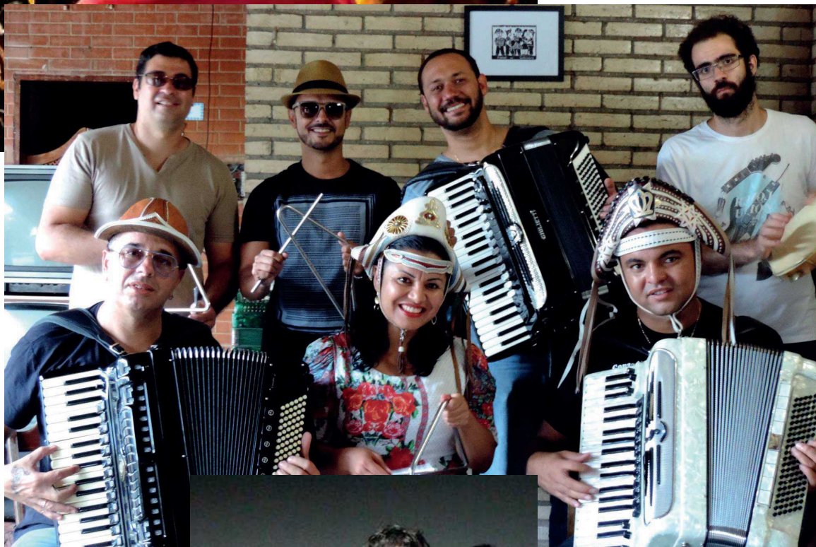
A banda Zabumbazul e o trio Cajarana (ao lado) são algumas das atrações da festa

Para manter a segurança e limitar o público, a organização decidiu cobrar o valor simbólico de R$ 5 de entrada, mas crianças menores de 5 anos entram de graça. Os ingressos são cobrados por dia e depois de pagar é possível entrar e sair quantas vezes quiser. Dentro da festa estarão disponíveis, além dos quites típicos, cenários para tirar fotos, caixas de conveniência e outros serviços. A decoração e o ambiente familiar é um dos principais atrativos da festa de São João guaranaense.