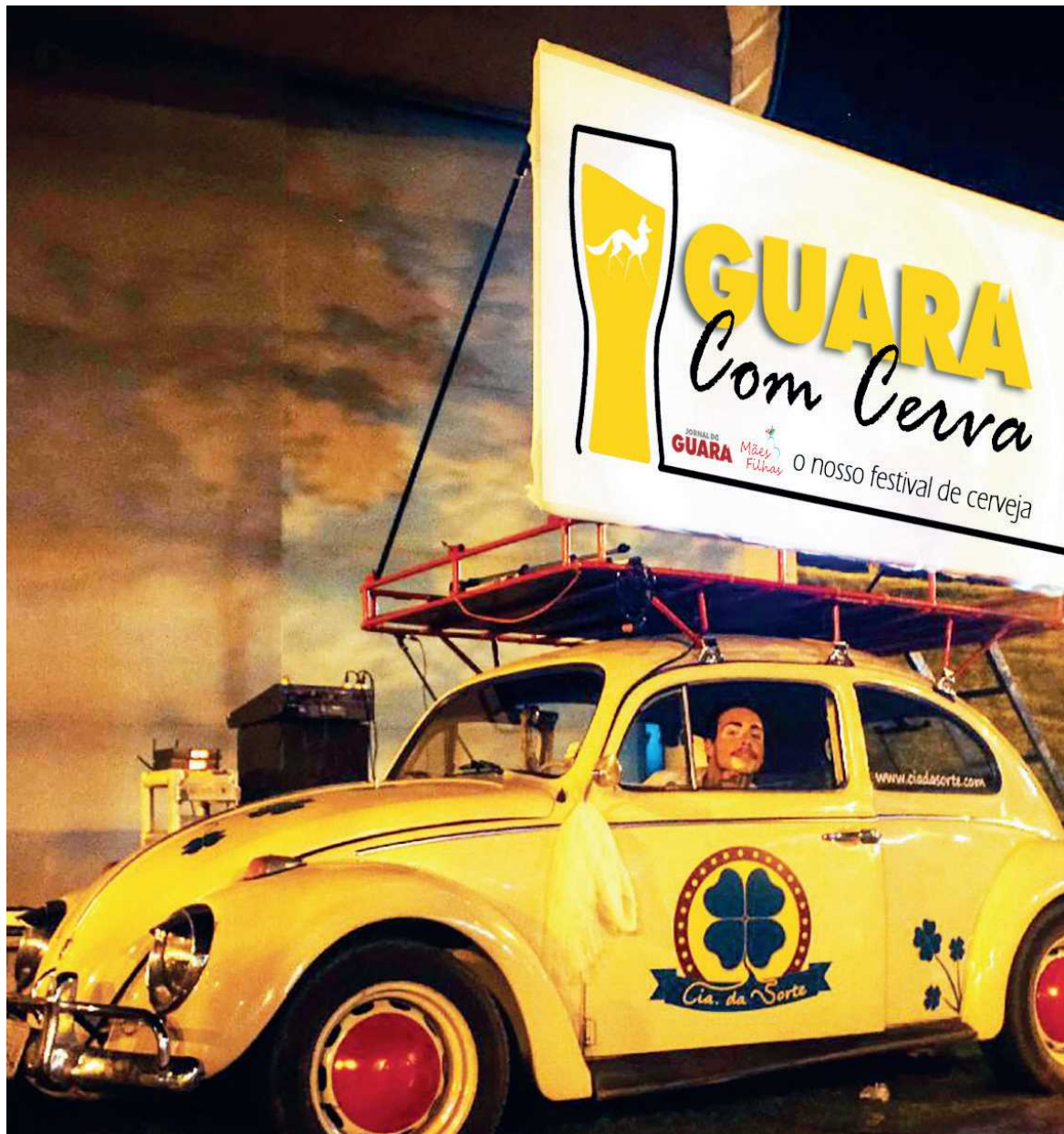
O Cine Fusca da Cia da Sorte vai exibir uma seleção de clipes musicais brasileiros

Foodtrucks, Foodbeers e exposição de artesanato e moda