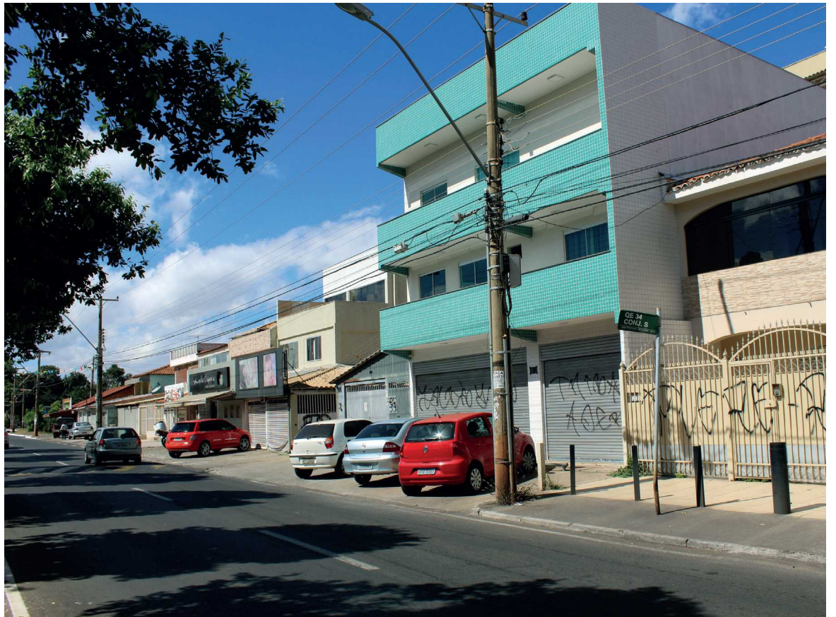
Todos os lotes residenciais voltados apra a Avenida Central do Guar poderão receber comércios

No Guar, a principal mudança para a cidade é destinação do lote. Brasília é uma cidade planejada. Esse rito foi cumprido não apenas no Plano Piloto, mas em várias outras regiões administrativas que foram criadas no papel antes de serem definitivamente ocupadas. E este é o caso do Guar. Ao pensar a cidade, os arquitetos e urbanistas delimitaram áreas residenciais ho-