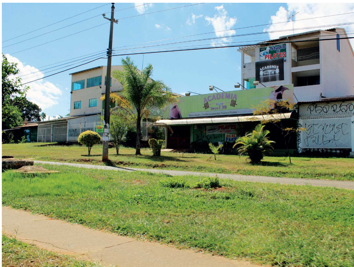
Um dos pontos mais controversos é a autorização de atividades comerciais nos lotes ao longo do anel externo do Guará II. Em alguns conjuntos, o fundo do lote dá para a área verde e em outros para uma pista interna. Em nenhum dos casos há previsão de estacionamento

No início do mês o governador Rodrigo Rollemberg publicou um decreto que perdoa quem construiu fora dos parâmetros previstos anteriormente à Luos como as construções em áreas residenciais horizontais com cinco ou mais pavimentos ou os prédios de pequenos apartamentos comuns no Polo de Moda, ou mesmo o avanço sobre a calçada em frente à sua loja, feita pelo comerciante para ganhar mais espaço. Se aprovado