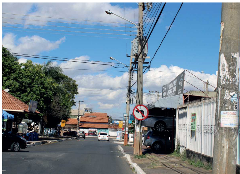
As esquinas das ruas centrais das quadras serão transformadas em áreas comerciais, como já acontece em vários pontos

pela Câmara Legislativa outro projeto de lei encaminhado pelo governador Rodrigo Rollemberg nesta semana, muitos proprietários poderão regularizar a situação de suas construções. O projeto foi protocolado pelo governador em regime de urgên-