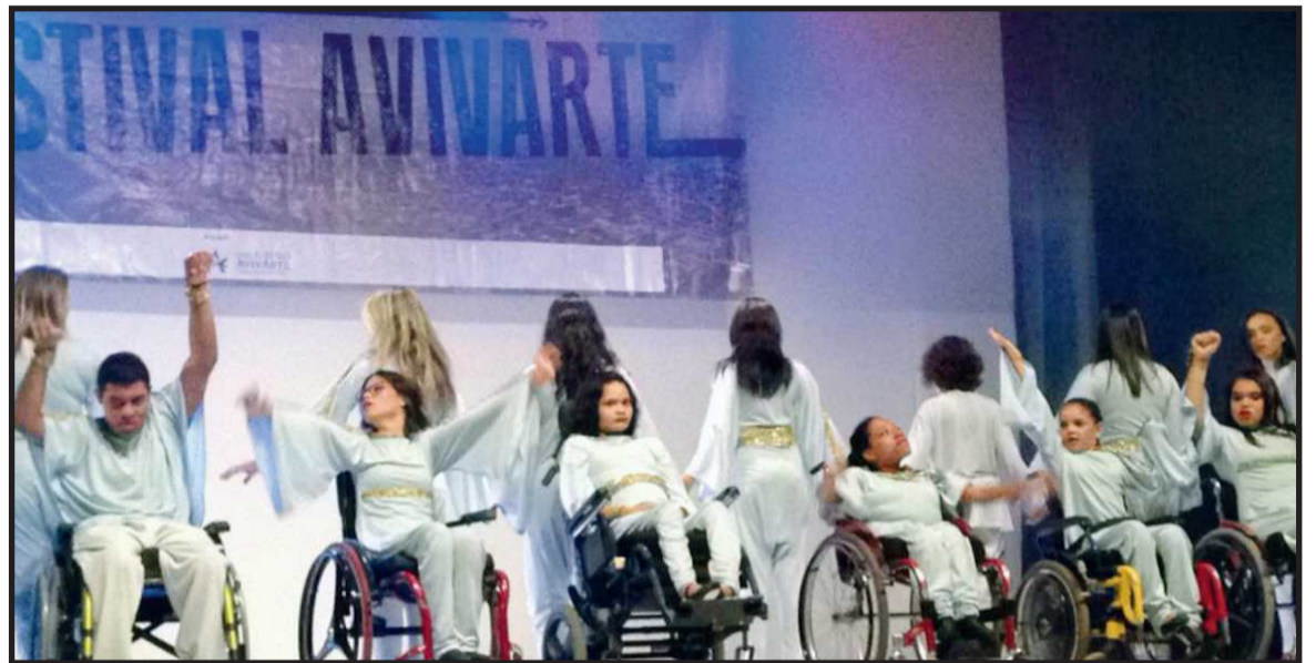
Apresentação da Avivarte na semana passada no Sesi de Taguatinga

Nas aulas específicas para deficientes é solicitada a par-