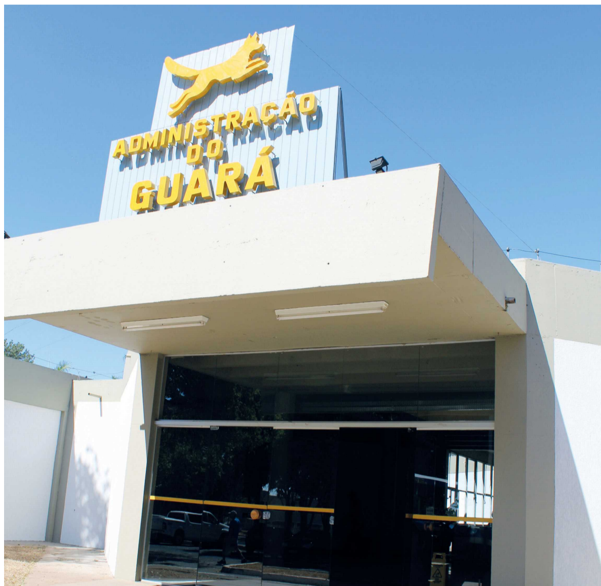
Loteamento dos cargos nas administrações regionais entre grupos políticos aliados é um dos principais impedimentos para o projeto andar na Câmara Legislativa

A regulamentação da Lei Orgânica, especificamente os Artigos 10 e 12, foi determinada pela Justiça em 2014. O Conselho Especial do Tribunal de Justiça do Distrito Federal e Territórios exigiu que o GDF e Câmara Legislativa regulamentasse a Lei Orgânica até o meio do ano passado. A decisão é fruto de uma Ação Direta de Inconstitucionalidade (ADI), impetrada pelo MPDFT, responsabilizando o Governo do Distrito Federal por omis-