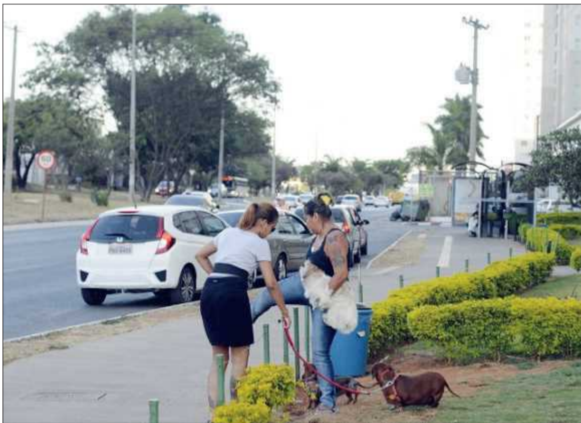
Moradores do condomínio reclamam do odor deixado pela sujeira dos cães