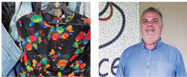
A renda arrecadada será destinada à manutenção da instituição, que assiste a centenas de crianças e adolescentes com câncer

Abrace promove, nos próximos dias 12 a 16 de dezembro, um grande bazar de Natal. As peças são doações feitas pela comunidade e a renda arrecadada será destinada à manutenção da instituição.