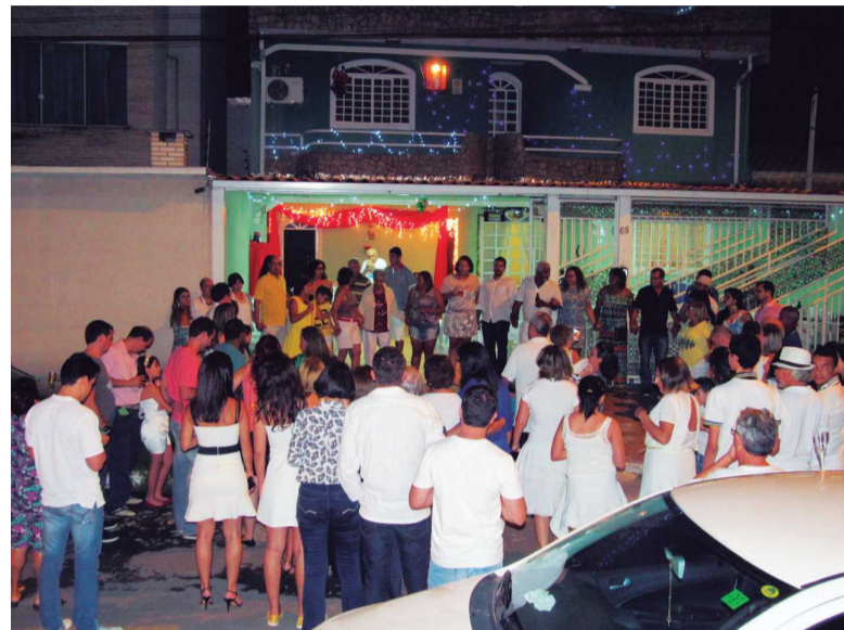
A programação prevê atividades para jovens e adultos durante todo o dia

bancos da praça e quem quiser pode levar o seu jogo também. Tudo isso acompanhado de música ao vivo, sorteios e a participação do Clube do Livro.