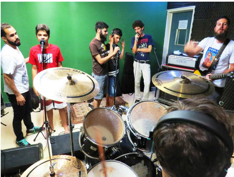
Os ensaios são no estúdio Formiguero, na QE 40 do Guará