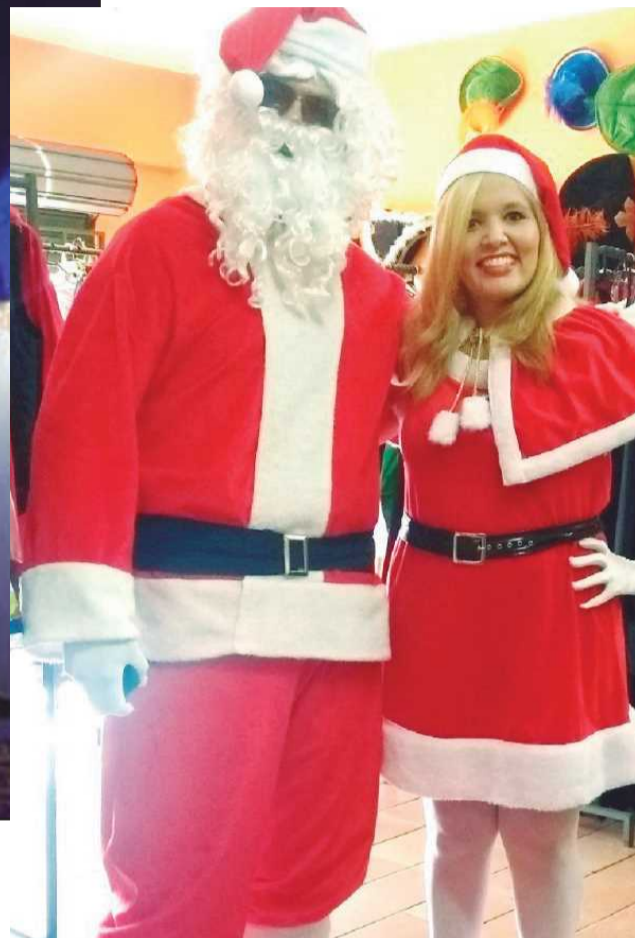
O Papai Noel da Acig tem circulado pelo comércio da cidade divulgando a promoção

contato até o dia 18 de dezembro. A premiação será entregue dia 23 de dezembro durante a Expomix, na Praça da Moda, na entrada do Polo de Moda.