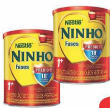
Leite em Pó Ninho 400g 1+