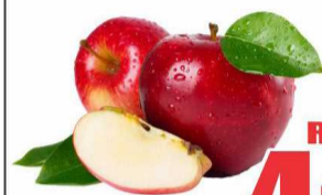
Maçã Gala kg