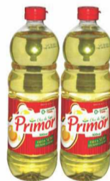
Óleo de Soja Primor 900ml