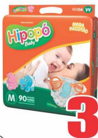
Fralda Hipopó Mega