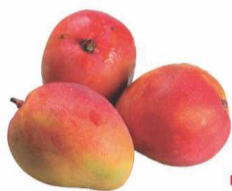
Manga Palmer kg