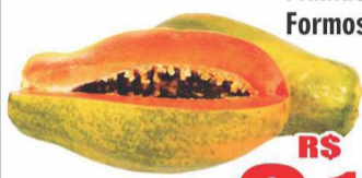
Mamão Formosa kg