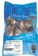
Peixe Cong. Mediterrâneo Piramutaba em Postas Pct. 800g.