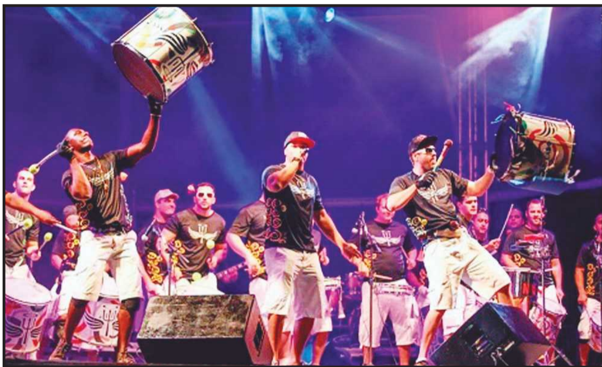
O bloco Santo Pecado é a principal atração do CarnaGuará, no dia 3 de fevereiro, entre as QES 21 e 36, em frente ao Edifício Pedro Teixeira

Um dos eventos que promete reunir mais guaraenses é a segunda edição do CarnaGuará, no fim da avenida Central do Guará II, em frente ao Edifício Pedro Teixeira. O evento começa bem cedo, no dia 3 de fevereiro, com a Corrida dos Foliões Kids. Um projeto pensado para promover práticas esportivas voltado para o público infantil e que visa a integração da Pessoa com Deficiência nas corridas de rua, já que serão utilizados triciclos adaptados e outros recursos adaptativos. Todas as crianças inscritas deve vir fantasiadas de sus personagens favoritos,