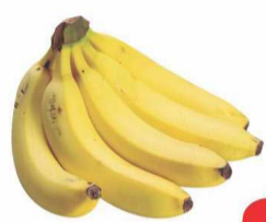
Banana Nanica kg

QUALIDADE E PREÇO BOM É SÓ AQUI, CONFIRA!