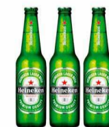
Cerveja Heineken 330ml Long Neck