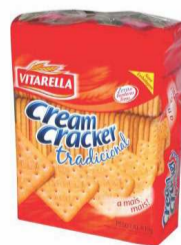
Biscoito Cream Cracker Vitarella 400g