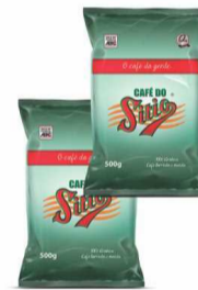
Café do Sítio Tradiciona Almofada 500g