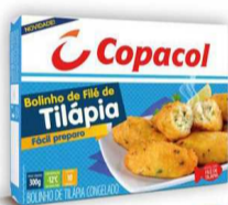
Bolinho de Filé de Tilápia Copacol 300g