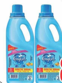
Amaciante Comfort Classic Leve 2 Litros Pague 1,8 Litros