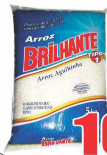
Arroz Brilhante 5kg

Variedade e economia, ofertas todo dia. Aproveite!