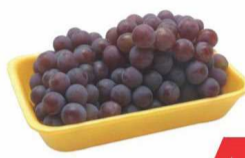
Uva Niagara bdj