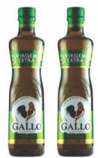
Azeite de Oliva Extra Virgem Gallo 500ml