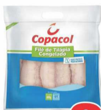
Filé de Tilápia Copacol 800g