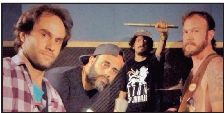
Corte Seco (acima) e Detrito Federal são destaques do bloco Carnaval É Meu Ovo, dia 10 de fevereiro no Edifício Consei