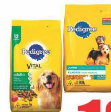
Ração Pedigree 900g / 1kg