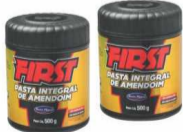
Pasta de Amendoim Int. First Santa Helena 500g