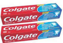
Creme Dental Colgate MPA 90g