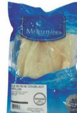
Peixe Filé de Merluza Mediterrâneo Pct. 800g.