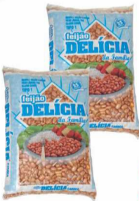
Feijão Carioca Delícia 1Kg.