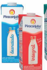
Leite Piracanjuba 1Lt. (Integral / Desnatado e Semi)