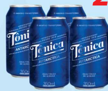
Água Tônica Antarctica 350ml 2,99 cada