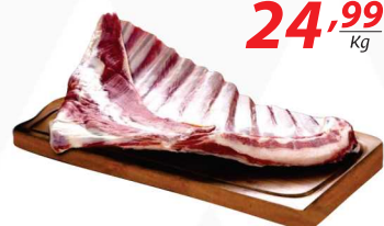
Costela de Cordeiro Uruguia La Parrila congelada 24,99 Kg