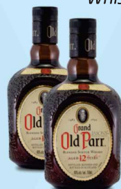
Whisky 12 anos Old Parr 750ml 98,00 cada