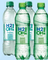
Refrigerante H2O Limão ou Limoneto 500ml 2,99 cada