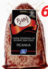
Picanha Bassi a vácuo 69,90 Kg