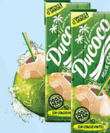
Água de Coco Ducoco 1L 5,99 cada

É proibida a venda de bebidas alcoólicas a menores de 18 anos conforme o Estatuto da Criança e do Adolescente.