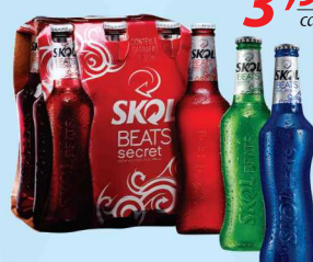
Skol Beats 313ml 3,99 cada