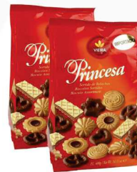
Biscoito sortido Princesa - 400g 12,99 cada