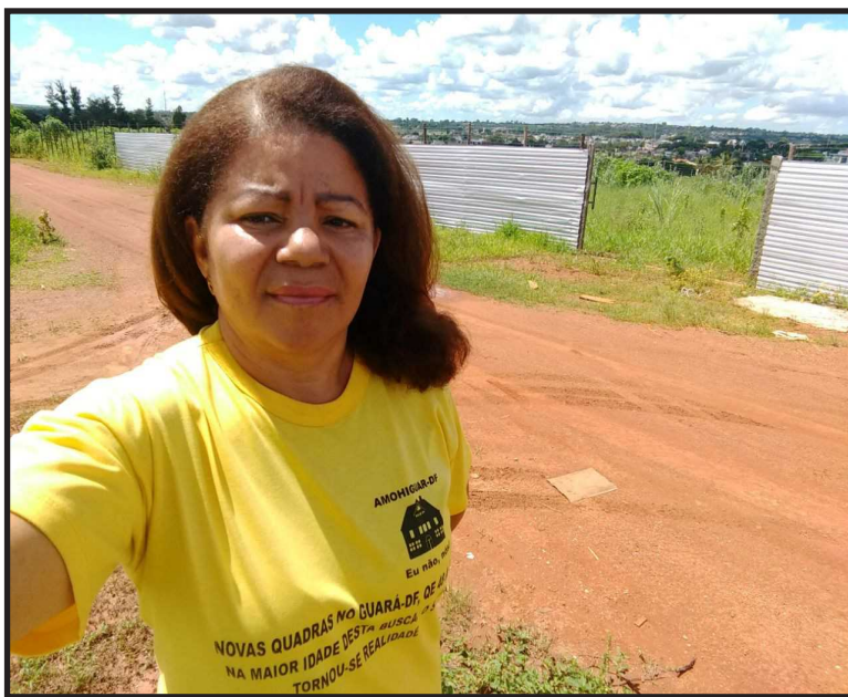
Edi ut omniat aut facea consedi repudit volut pratiam rem ditempe nonsequam quas exerchic temo consequi blaturi busdaes et

Até aí, tudo bem, mas uma decisão posterior da Codhab assanhou os dirigentes das 73 cooperativas habitacionais selecionadas anteriormente, por terem