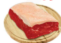
Contra filé bovino 19,99 Kg