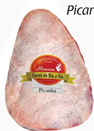
Picanha Minerva Tipo "A" a vácuo 29,99 Kg