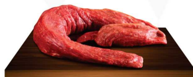
Filé mignon com cordão a vácuo 29,90 Kg