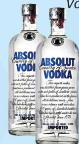
Vodka Absolut tradicional 1L 79,90 cada