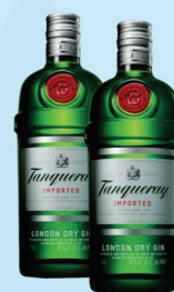
Gin Tanqueray 750ml 99,00 cada