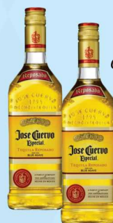
Tequila Jose Cuervo ouro ou prata 750ml 59,90 cada