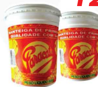
Manteiga Paracatu 500g 12,99 cada