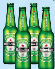
Cerveja Heineken longneck 330ml 3,79 cada