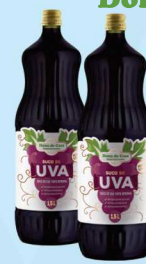
Suco de Uva Integral Dona de Casa 1,5L 12,99 cada