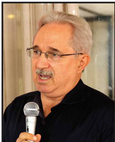
Giordano lembrou que nunca permitiu que qualquer funcionário lesasse ou enganasse donos de imóveis ou inquilinos. O que explica a grande fidelidade da maioria dos seus clientes