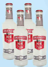
Vodka Smirnoff Ice 275ml 3,99 cada