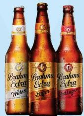
Cerveja Bhrama Extra - longneck 355ml 2,99 cada