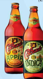
Cerveja Colorado (Exceto Vixnu) 600ml 9,98 cada