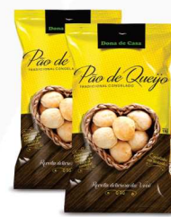
Pão de Queijo Dona de Casa 1Kg 12,99 cada