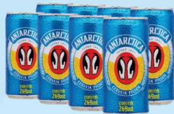
Cerveja Antarctica 269ml 1,89 cada