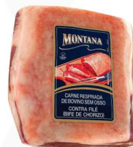
Bife de Chorizo Montana - a vácuo 34,90 Kg