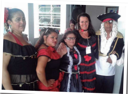
O grupo do CCI da Cidade Estrutural veio com as fantasias combinando