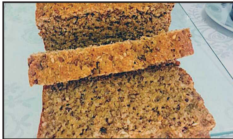
O pão integral caseiro da BM & G contém glúten, a receita é a base de aveia que é uma fonte da proteína. O pão integral ainda leva em sua receita, o açúcar mascavo, a linhaça e o farelo de trigo.