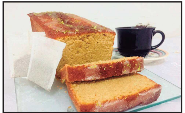
Você vai se surpreender com o sabor leve e diferente, e o mate ainda contém vitamina E, e é diurético e estimulante.