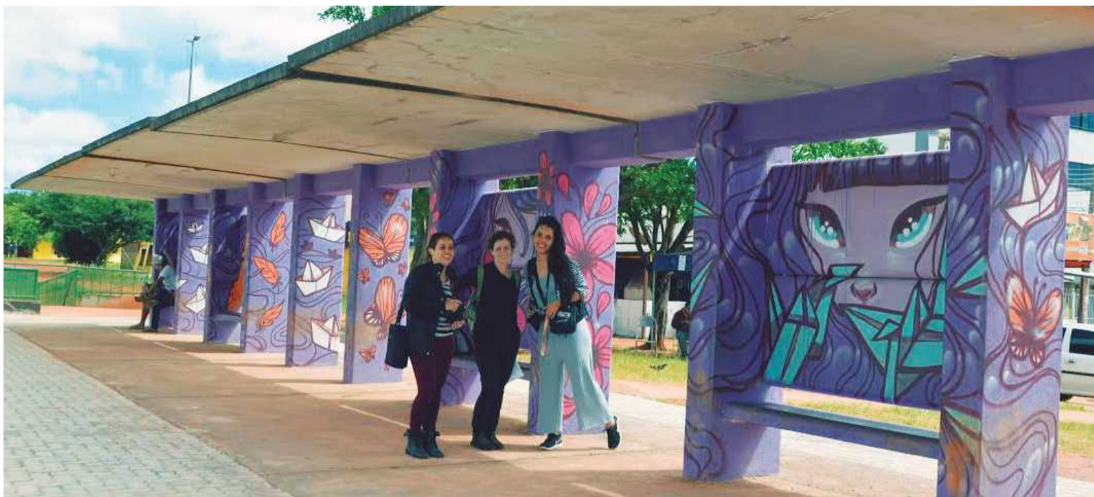
Artistas se ofereceram para recuperar os abrigos de passageiros. Plantio de mudas e atendimento aos moradores completaram as atividades

Quem passava pelo ponto de ônibus localizado na marginal da EPTG, sentido Taguatinga, pôde perceber a mudança na paisagem do local ao longo da manhã. Sete grafiteiras deram cores às paredes por meio de desenhos cheios de vida.