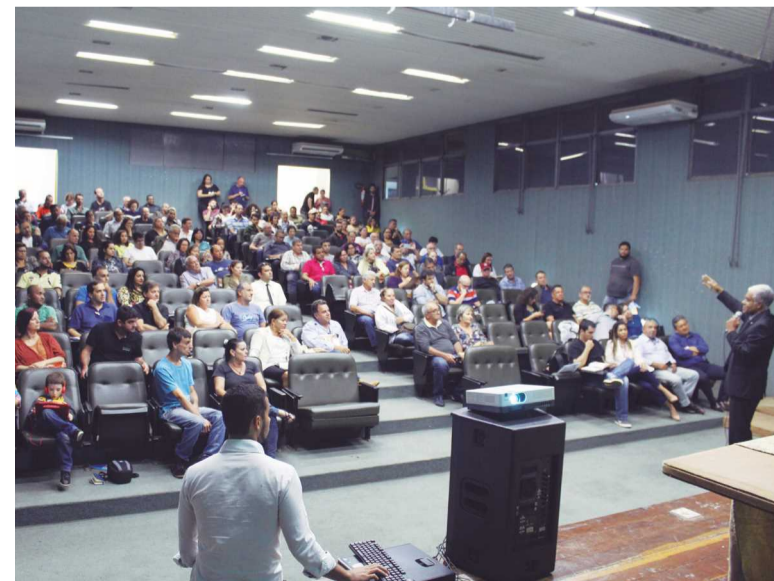
Reuni4o na Administra4o do Guar4 reuniu cerca de 150 moradores para ouvirem sobre processo de regulariza4o