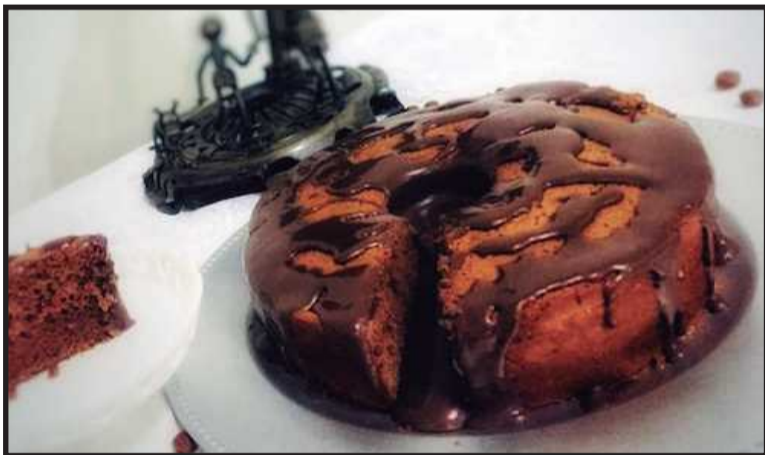
Massa e cobertura de chocolate. De sabor inigualável, o vulcão de chocolate é uma fonte de proteína, energia e é bem nutritivo. Temos nos tamanhos, médio e grande.

Gordos, existem os especiais, como é o caso do bolo da Cici, que é preparado com especiarias orientais e melado de cana, além do pão integral caseiro. Mas, seja qual for a categoria, os ingredientes da família BM & G, são os mesmos: ovos, leite, amor, carinho e alguns segredinhos.