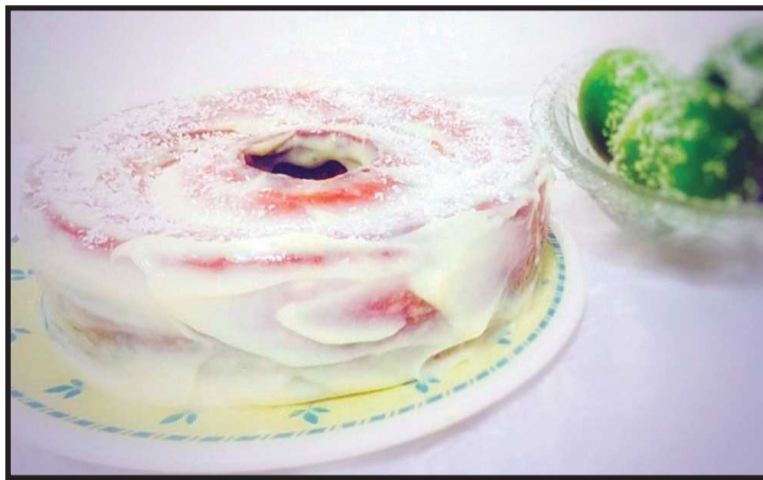
Uma das alergias alimentares mais comuns é a alergia ao ovo. Este é um bolo especial com cobertura de mousse de limão e coco

O site é bem intuitivo: o cliente escolhe entre o bolo preferido, a forma de pagamento e em poucas horas o bolo chega em casa. Como qualquer outro delivery de comida. Obviamente, como os bolos são feitos na hora, demora um pouquinho mais, mas dá pra prever tranquilamente o lanche da tarde ou o café da manhã.