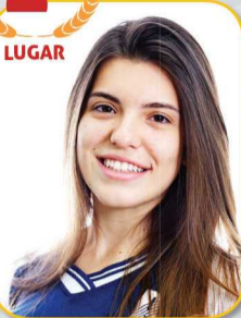
BRUNA STEFANI DALI AGNOL ARQUITETURA - UNB