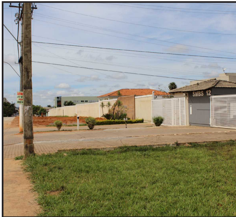
Setor aguarda apenas o registro em cartório dos lotes para venda direta aos ocupantes

não serão derrubados, já que há uma grande chance de serem legalizados num futuro próximo. Mesmo assim, não há necessidade de formalização de associações e condomínios neste momento, já que os lotes serão vendidos individualmente para pessoas físicas, ocupantes de cada lote.