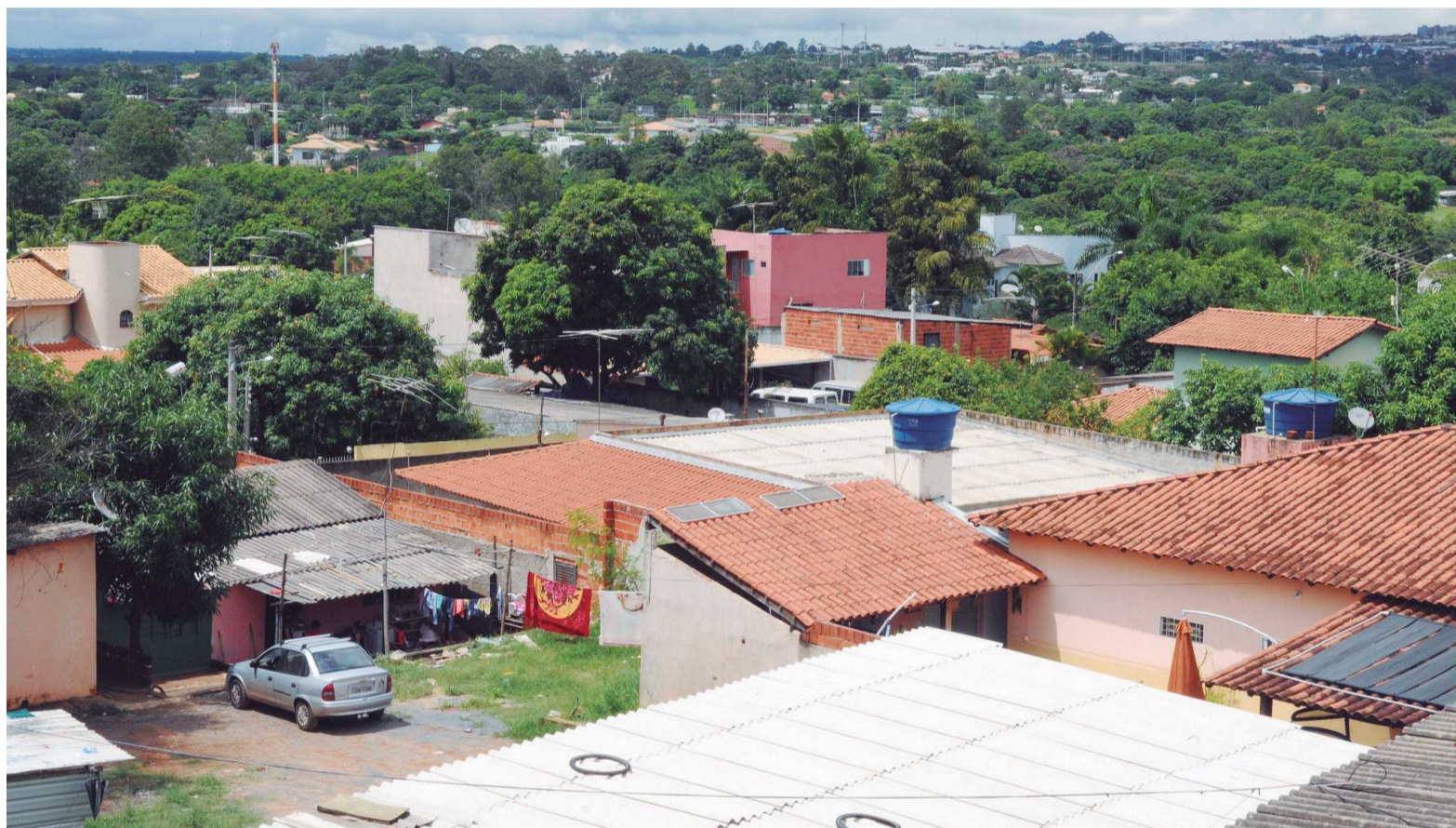
A regulariza4o depende da conclus4o das obras de escoamento de esgoto e 4guas pluviais, que est4o em fase adiantada