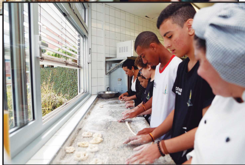
Depois da degusto de pratos tpicos, os alunos aprenderam a modelar os tpicos bretzels