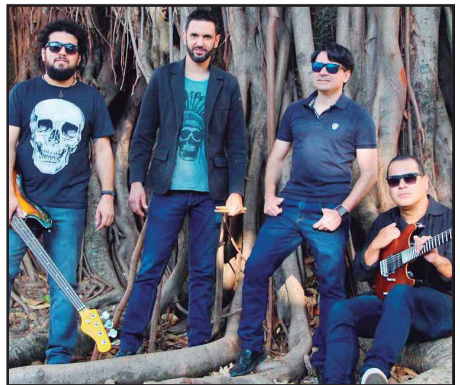
Brazilian Blues Band, no alto, e Tex Quarteto Instrumental participam da coletânea com músicas inéditas

A Uivo estará disponível nos serviços Spotify, Deezer, Tidal, AmazonMusic, AppleMusic, GooglePlayMusic e iTunes a partir do dia 19 de maio.