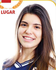
BRUNA STEFANI DALI AGNOL ARQUITETURA - UNB