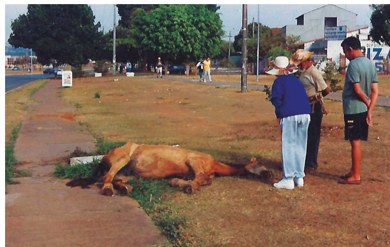
Uma das poucas regiões do DF onde a carroça continua permitida, acontece no Guar4 maior quantidade de maus tratos a animais

graves. Agora, o fiscal pode aplicar a correção, ao identificar a situação de crueldade, no valor de 1 a 40 salários mínimos.