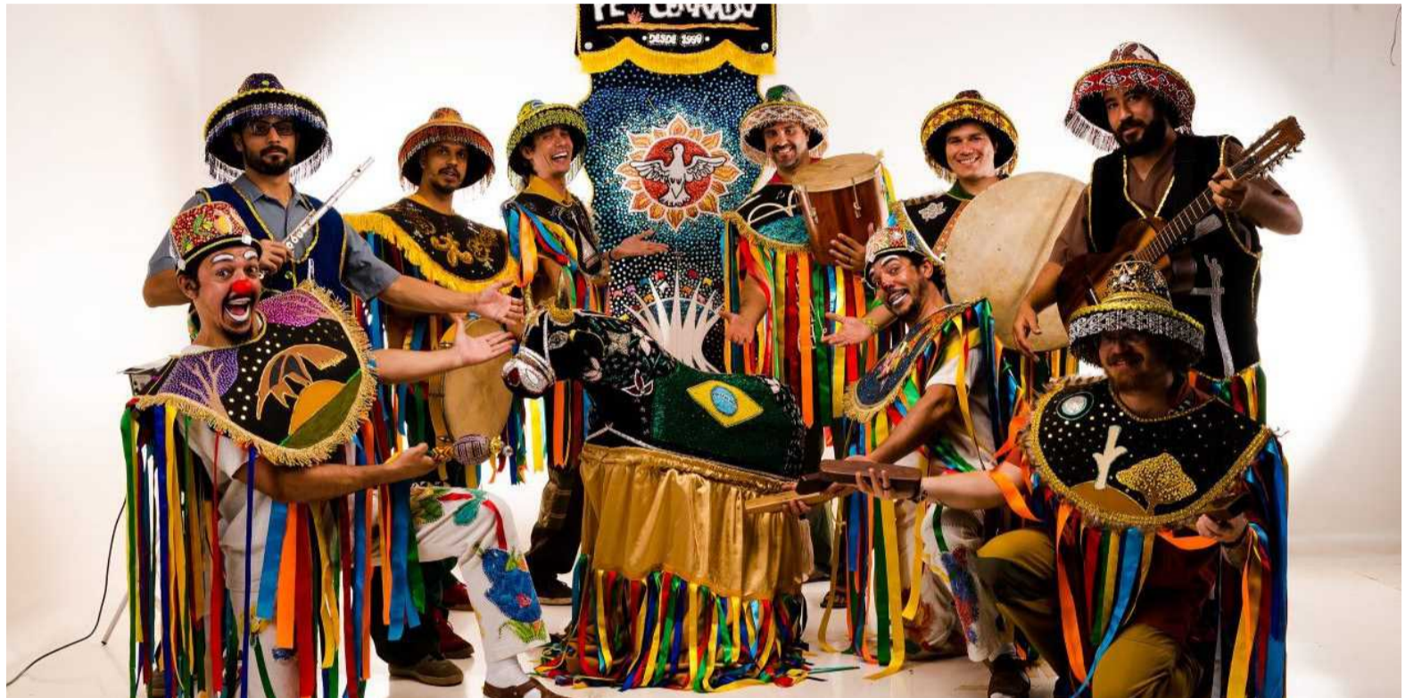
O grupo guaraense Pé de Cerrado é a atração do Arraiá do guará no domingo, ao lado da Delegacia de Polícia