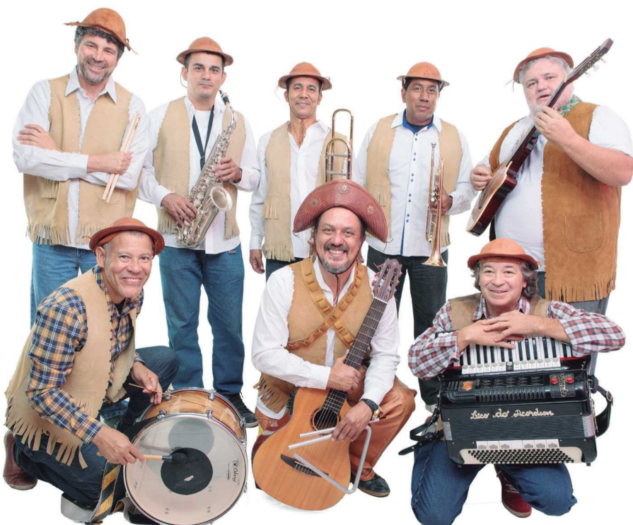
Os Cangaceiros do Cerrado apresentaram-se na sexta, 8 de junho, no Arraiá do Guará

No São João do Guará vão se apresentar o trio Balançado, a banda Potência do Cerrado, o Forró 3 de Maria e a Encosta N’eu. Mas, certamente as atrações mais aguardadas são as quadrilhas Rasga Saia, Paixão Cangaco e Coisas da Roça, famosas no Distrito Federal e região. Cada quadrilha é composta por dezenas de dançarinos e os figurinos e a caracterização encantam.