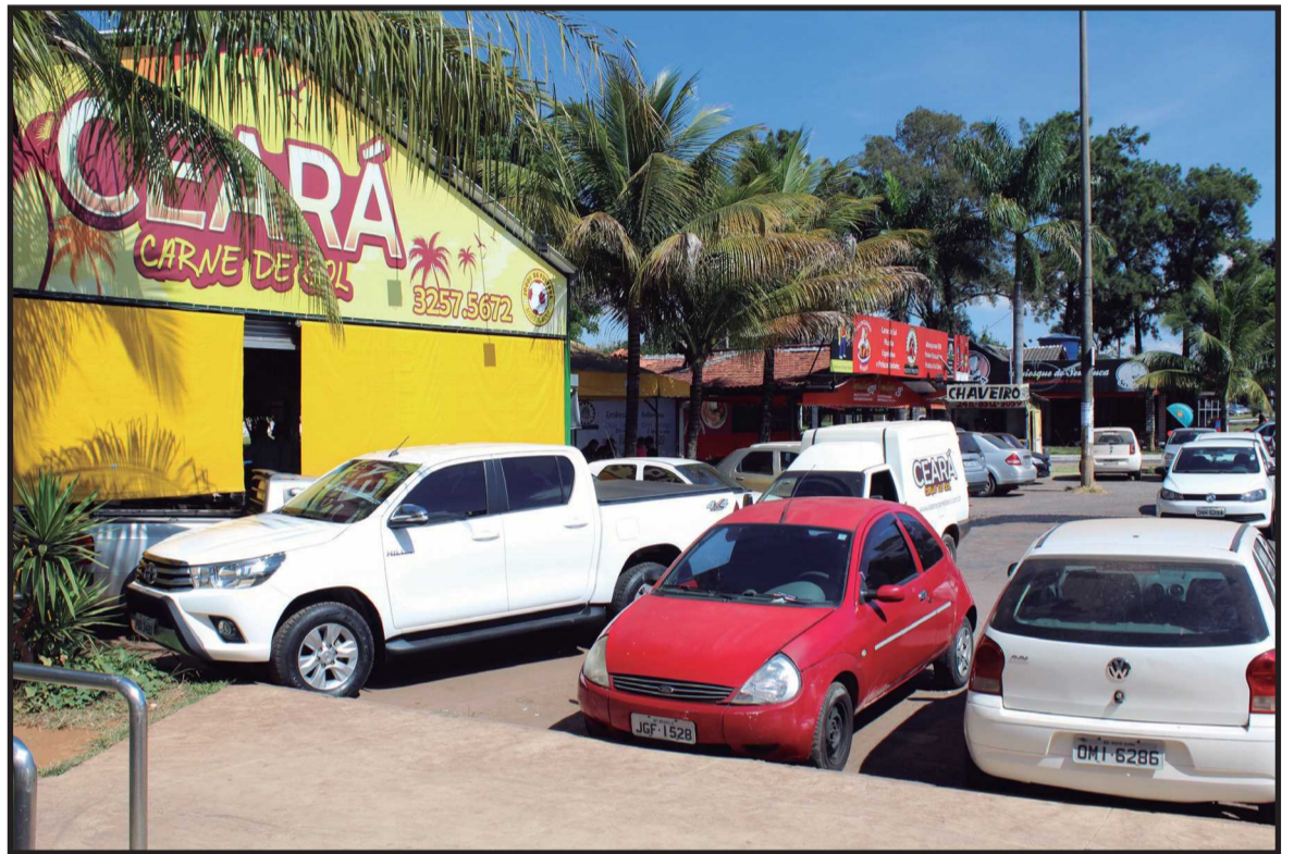
Depois do cadastramento, a Agência de Fiscalização do Distrito Federal (Agefis) passará a fazer o controle do funcionamento de todos os quiosques e trailers do DF.

Depois do cadastramento, a Agência de Fiscalização