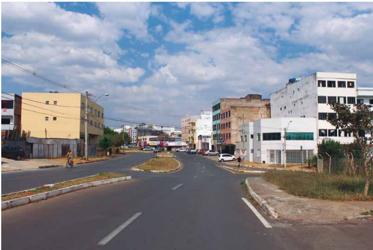
A aprovação da Luos seria a saída jurídica para as residências no Polo de Moda e QE 40

O Governo provavelmente vai rever a proposta da lei. Como a Luos trata apenas de lotes existentes e legalizados e recentemente várias áreas tem sido legalizadas e criadas, como os condomínios no Jardim Botânico, Vicente Pires, e os do Guará, as quadras 500 do Sudoeste e outros, a lei precisará de vários aditivos e