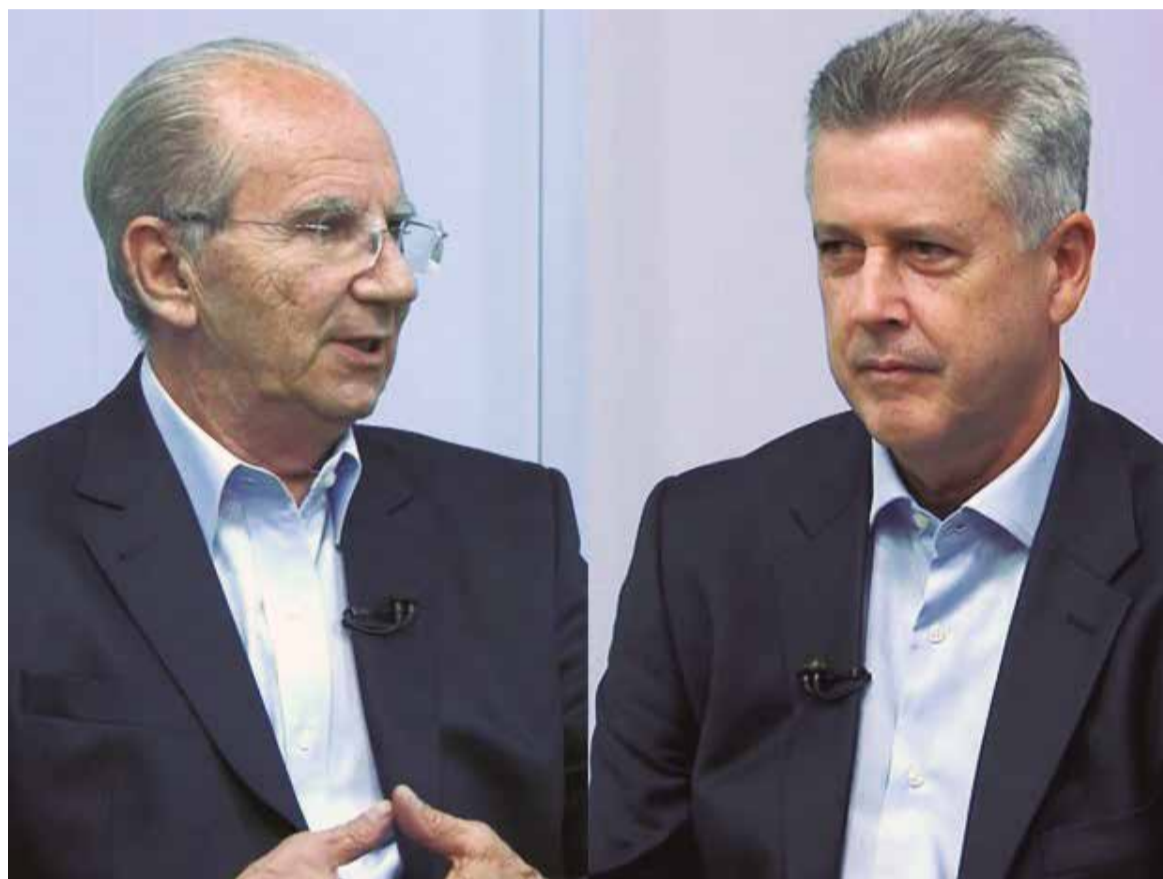
Se a eleição fosse, Frejat e Rollemberg disputariam o segundo turno, de acordo com a pesquisa

No ninho tucano, Izalci precisa colocar as barbas de molho. O general Chagas