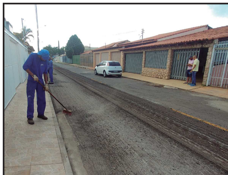
Toda a QE 13 vai receber nova cobertura asfáltica

Cumprindo a programação de construção e reforma de calçadas na cidade, a Administração Regional do Guará informa que duas calçadas na a QI 03 na área verde em que liga prédios e casas, conhecido como o "Quadrado da 3".