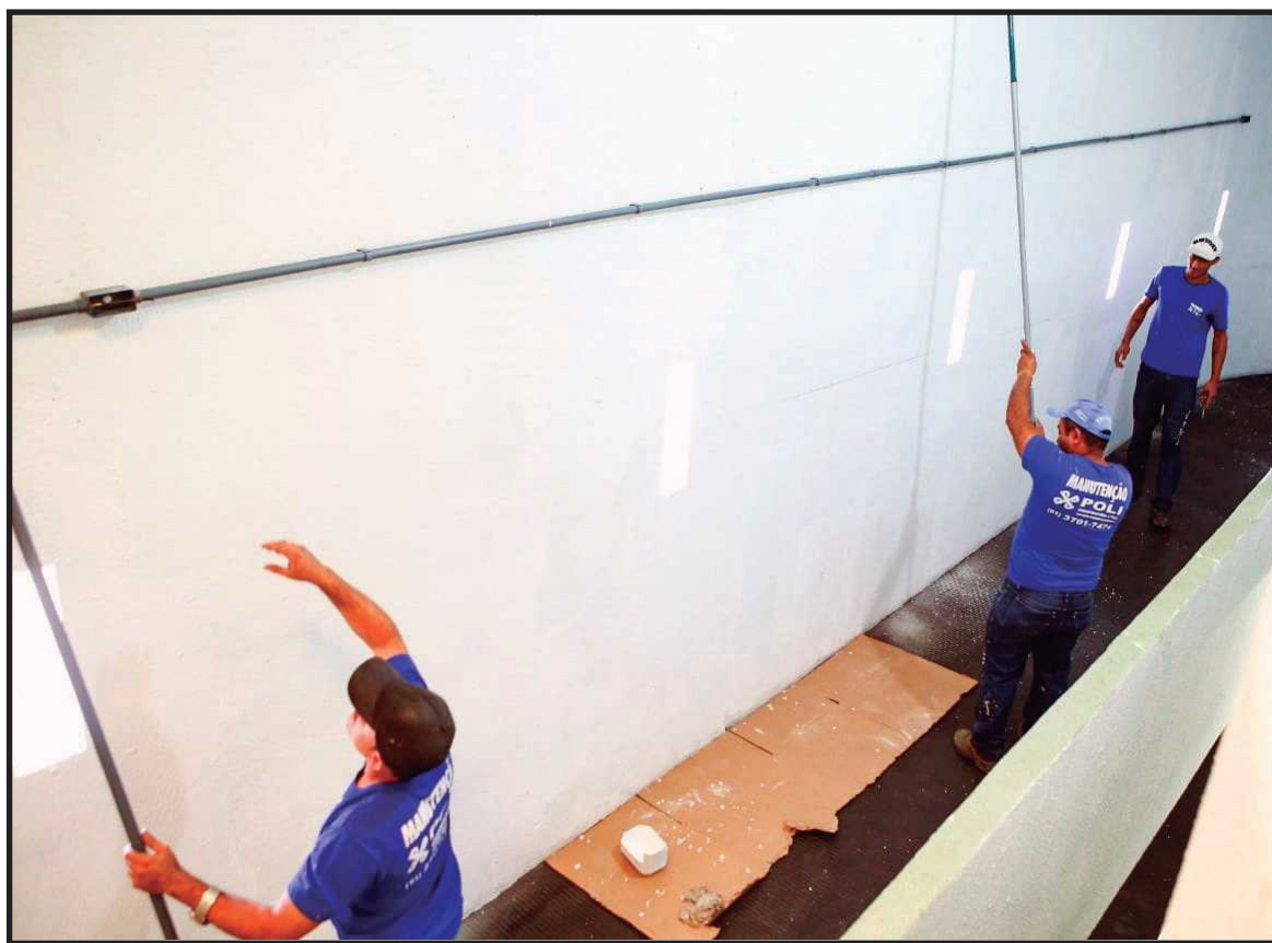
Obras começam pela pintura da parte interna