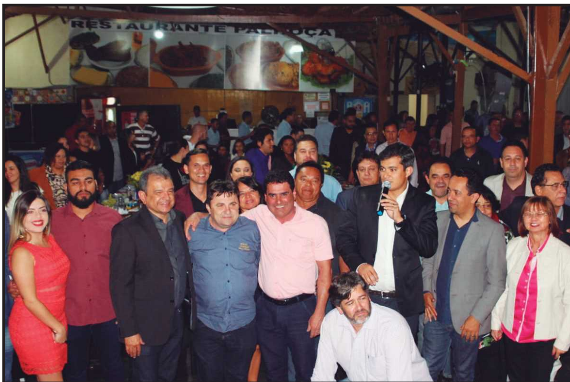
Apoiadores e amigos encheram o Palhoça para prestigiar o candidato

Líderes religiosos, empresários, ex-administradores regionais, presidentes de associações, lideranças comunitárias, amigos, correligionários e políticos marcaram presença no evento e aplaudiram o discurso de Brandão, que con-