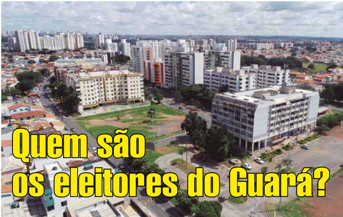
Responsável por quase 6% do eleitorado de Brasília, a cidade registrou um pequeno crescimento no número de eleitores desde a eleição passada

A 9ª Zona Eleitoral (que além do Guará inclui a Estrutural e o SIA) tem hoje 124 mil pessoas aptas a votar no dia 7 de outubro, pouco mais de 10 mil eleitores em relação a 2014. Destes, 11 mil votam na Cidade Estrutural. Um quarto de todos os eleitores tem entre 30 e 40 anos de idade, e mais da metade é solteiro, mostrando que o Guará ainda é uma cidade predominantemente jovem, como todo o Distrito Federal. Curiosamente, apenas 181 eleitores de 16 anos podem votar na cidade, contra 199 eleitores com mais de 90 anos. O Guará destaca-se pela alta escolaridade de seus eleitores, com 31% tendo completado o curso superior, enquanto apenas 717 declararam-se analfabetos.