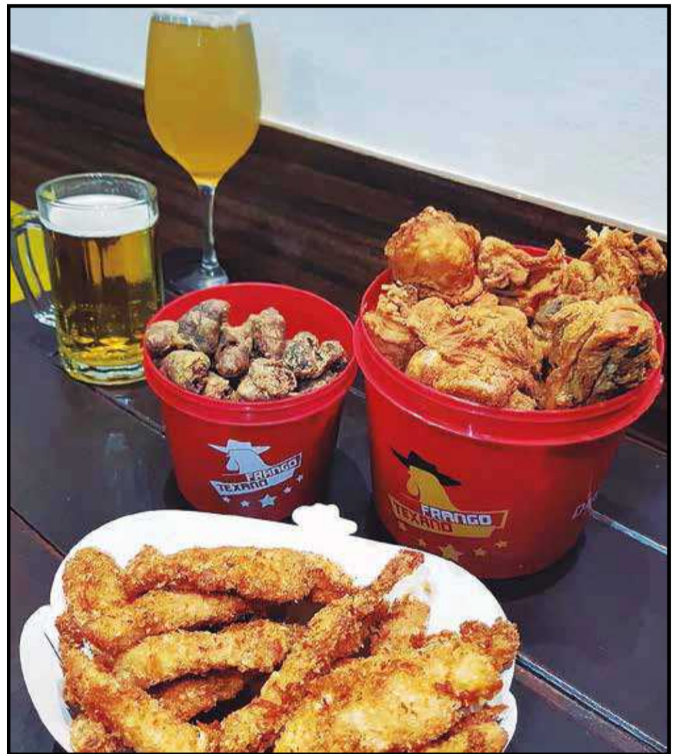
Vários cortes do frango são oferecidos na casa, além de sucos, drinks e caneca de chopp a apenas R$ 4,99

Os acompanhamentos estão à altura dos pratos principais - batata frita nas versões simples, queijo ou cheddar e bacon, anéis de cebola, polenta palito frita simples, ou o cliente pode optar pela polenta com queijo e cebolinha. Se estiver em dúvida ou com vontade de saborear todas elas, têm as porções mistas, por exemplo, anéis de cebola com batata frita, ou batata frita com polenta. Mesmo se tratando de uma franquia, todos os ingredientes são preparados na unidade, garantindo ao público a certeza de estar ingerindo alimentos frescos e de qualidade.