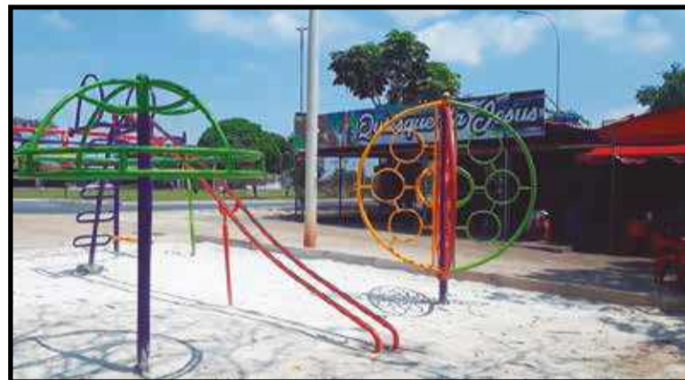
Este parquinho foi instalado a pedido dos donos dos quiosques ao lado. Os bares oferecem música ao vivo aos finais de semana sem alvará. O parquinho em perfeito estado foi retirado da praça da QE 2, onde outro foi colocado, ao custo de R$ 45 mil

Feira do Guará possui areia e meio fio, esta não é a realidade dos novos equipamentos. A Administração Regional pediu à Novacap a compra dos parquinhos e não previu que precisaria de comprar areia, bancos e alambrados. O resultado são os equipamentos instalados precariamente nas praças, como na QE 38, sobre o concreto e expostos, trazendo risco às