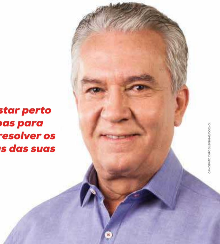
CANDIDATO CHUJ 31.208.843/0001-01