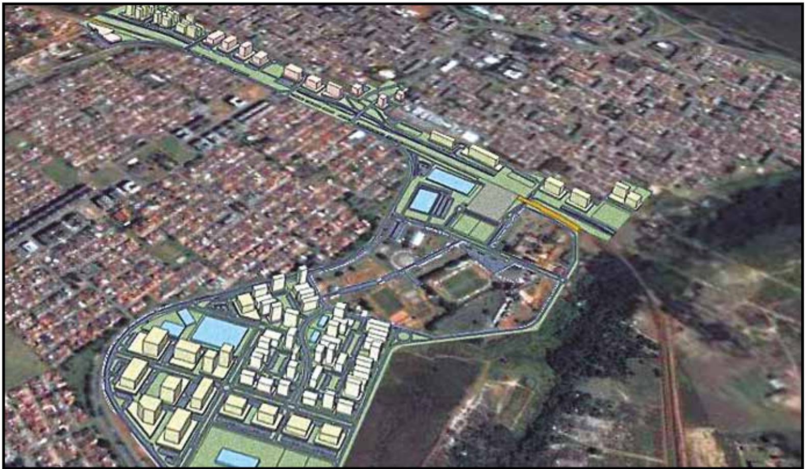
O adensamento do percurso da Interbairros prevê o surgimento do Centro Metropolitano do Guará, um conjunto de edifícios residenciais, comerciais e de prestação de serviços entre o Guará I e o Guará II e também de todo o Cave

A consequente geração de emprego e renda nas regiões administrativas pela