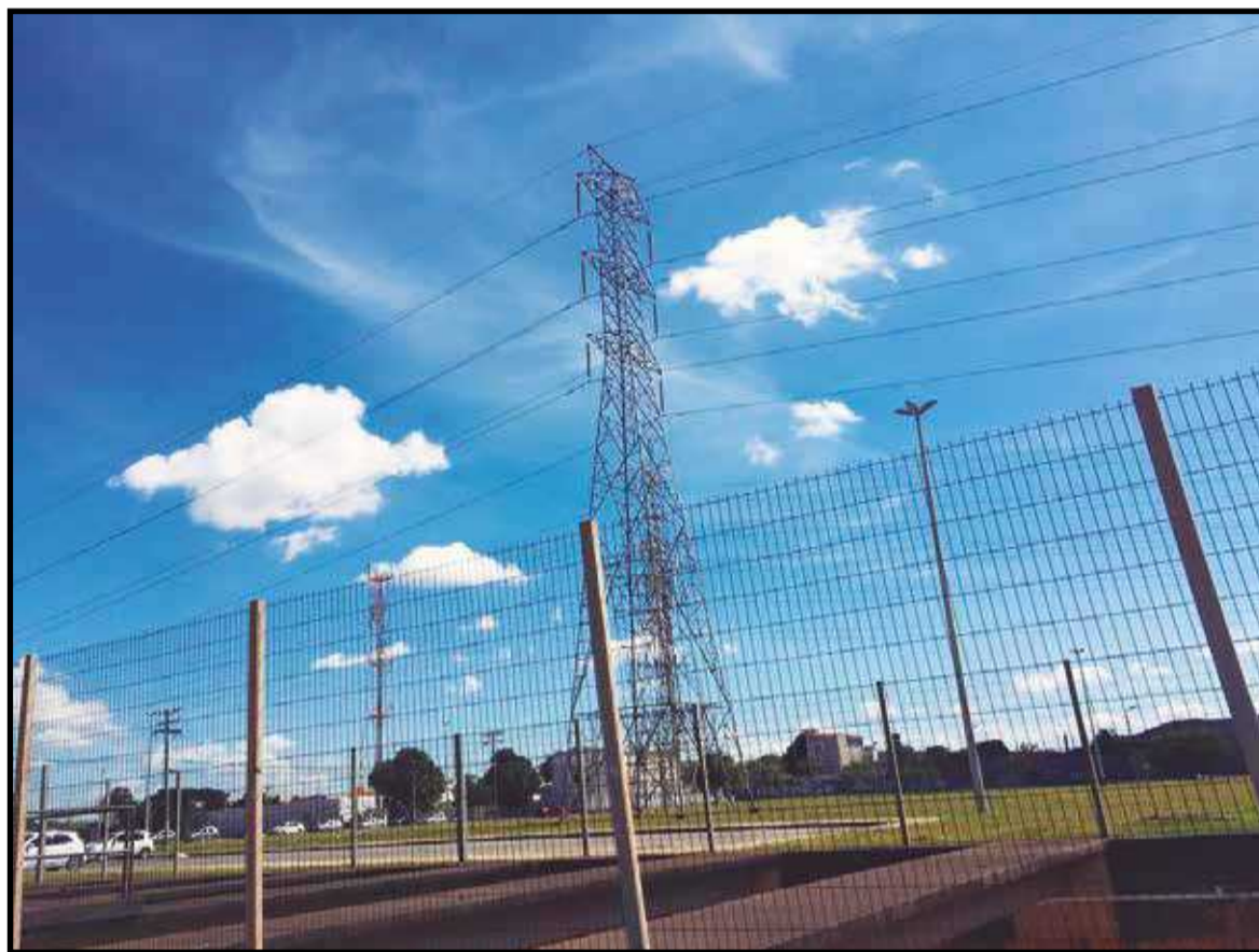
Para a ocupaç4o das margens da via, ser4 necess4rio o aterramento da rede de Furnas

Em nota, o governo explicou ter recebido estudos para a parceria p4blico-privada (PPP) em març4o de 2017 por meio de Procedimento de Manifestaç4o de