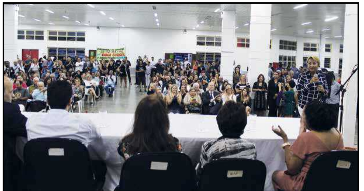
A posse da administradora, o Salão do Cave, foi muito prestigiada por cerca de 300 convidados

Diferente, melhorado pela mão de uma mulher que vai fazer o impossível aqui. Vamos cuidar dos parquinhos, das praças, das quadras e das áreas verdes. Se tivermos vontade e uma equipe boa, poderemos fazer muito. Vamos valorizar o serviço do pessoal da obra, que dá cara ao Guará. Tem muito serviço aqui no gabinete, processos pra liberar, licenças, enfim, mas quero mesmo é traba-