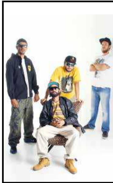
Nova Raiz, Os Cabeloduro e Brazilian Blues Band, bandas guaraenses se apresentam no sábado.