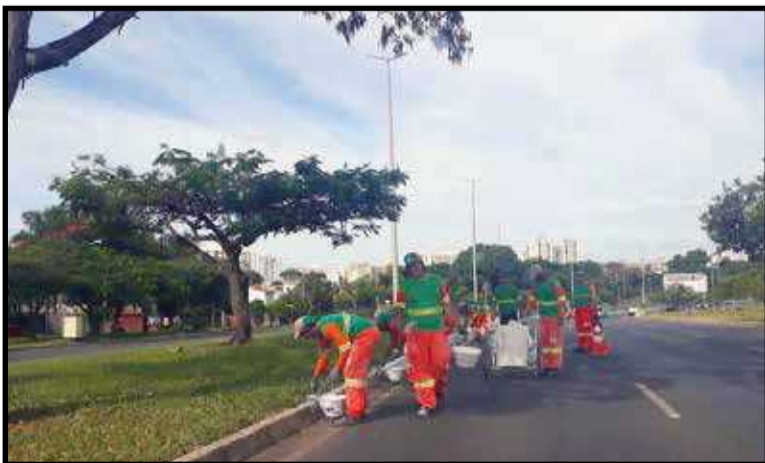
O mutirão SOS DF veio em janeiro e está prometido para março. A ideia é manter a cidade limpa

Outra prioridade é o Hospital do Guará. Sei bem que não é de responsabilidade da Administração Regional, mas tudo que passa pela cidade