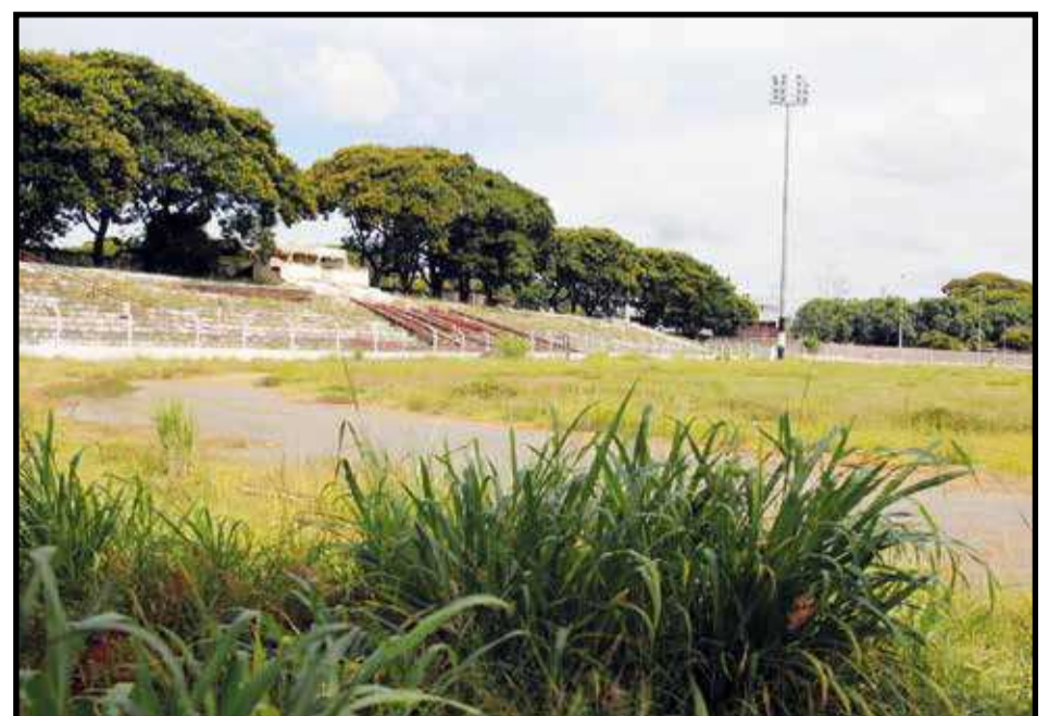
e na implantação do gramado, que corre risco de não ser mais recuperado

Enquanto havia a perspectiva da retomada da reforma, a construtora manteve seu canteiro de obras no estádio e ajudava a Novacap na manutenção do gramado, principalmente por causa dos riscos de perda da grama na época da seca em Brasília. Mas, no final do ano passado, a construtora abandonou totalmente a obra e retirou o que tinha lá, deixando o gramado ser tomado pelo mato em época de chuva.