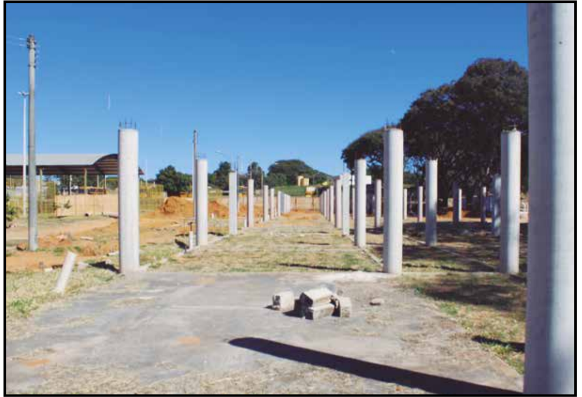
Já foram gastos cerca de R$ 800 mil na estrutura do vestiários...