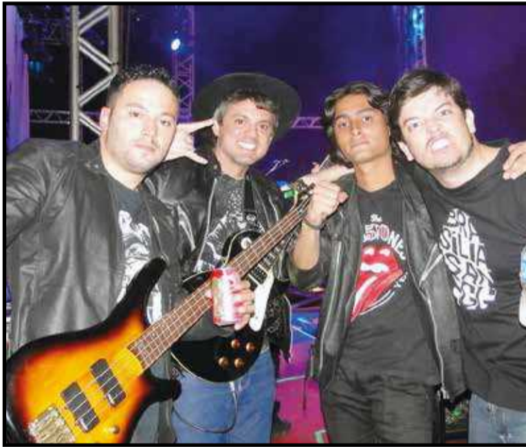
A Marimbondo é uma das bandas convidadas para o Guará com Cerva

Não é montada nenhuma grande estrutura - a ideia é criar um ambiente intimista e tranquilo. Alguns foodtrucks se unem à iniciativa para oferecer ao público uma experiência mais completa. E uma área com brinquedos inflá-