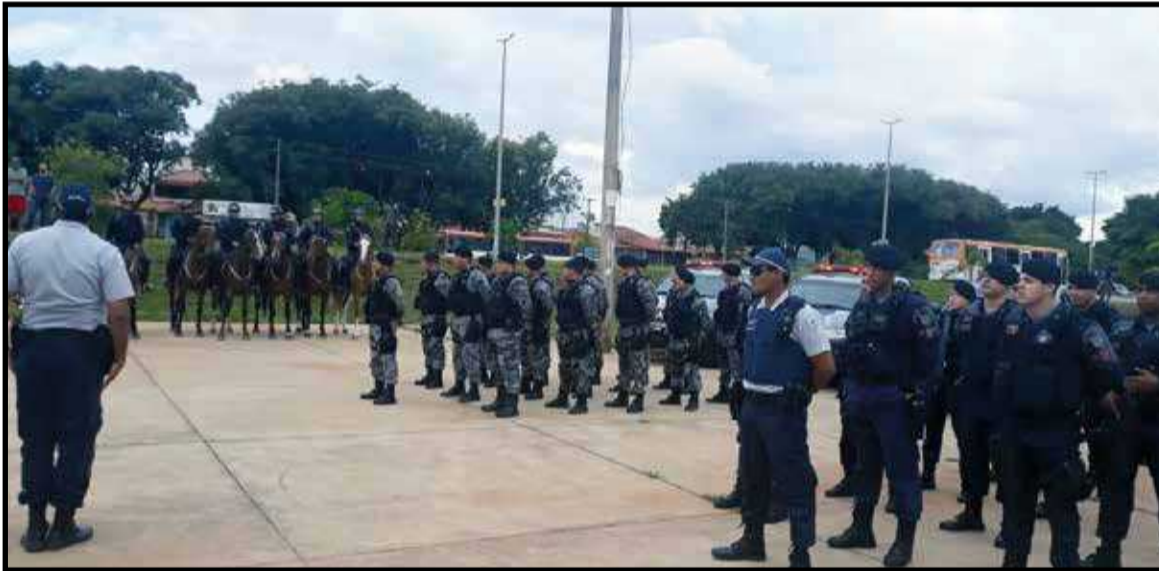
Centenas de militares reforçam a segurança no Guará na Operação Presença

ficando completamente nosso cenário urbano, trazendo empregos e fortalecendo a economia da cidade. Além de criar uma outra alternativa para o trânsito local. O Cave, incluindo o estádio e o ginásio, e o kartódromo, também serão viabilizados via PPP, que vai trazer enormes benefícios para a população. Estes são apenas os projetos em andamento, mas o novo hospital do Guará, a Feira e outros equipamentos públicos também podem ser beneficiados por PPPs. Por isso, acredito que a cidade passará por grandes mudanças nos próximos anos e cabe a nós ter responsabilidade e competência para administrar.