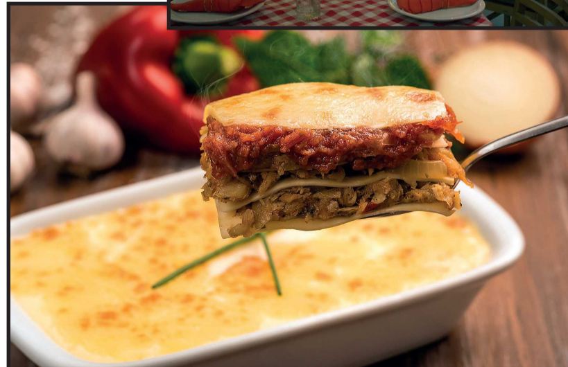
Lasanha de bacalhau com queijo ao molho branco (R$ 40,90)