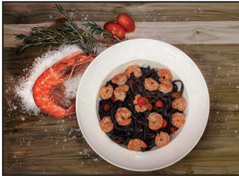
Talharim com massa de tinta de lula, salteado com azeite de ervas frescas, camarões e tomates cereja (R$ 49,90)