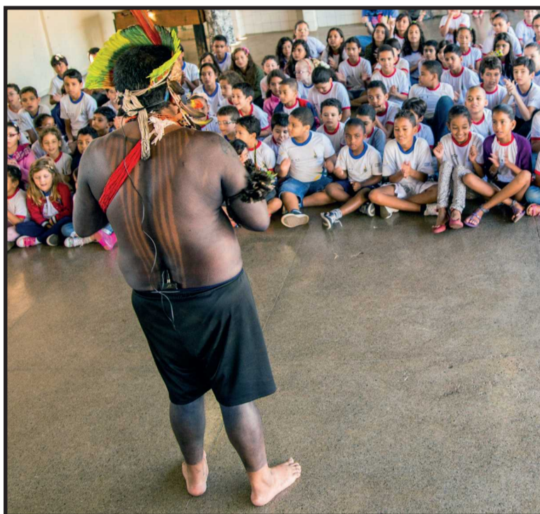
A iniciativa é um reconhecimento da importância dos índios na formação do povo brasileiro. Atualmente, existem no Brasil mais de 230 etnias indígenas, mostrando a imensa diversidade dessa cultura

Uma novidade nesta edição é a entrega de um DVD do documentário inédito Curumins. O curta, com 16 minutos, mostra como vive a tribo Kamayura no Mato Grosso, com aproximadamente 500 índios, que vivem da