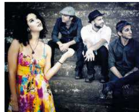
Durante o Guará com Cerva, no domingo, a banda Astride mostrou a capacidade de envolver o público