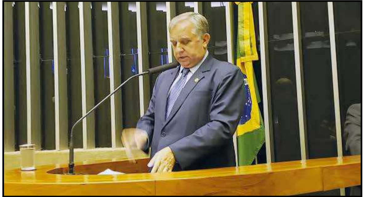
O papel de coordenador não traz cargos ou benesses ao escolhido, apenas a obrigação de negociar R$ 400 milhões em emendas ao orçamento para o Distrito Federal

“Foi um gesto grandioso por parte da deputada. Essas emendas foram apresentadas nas gestões anteriores e apenas eu e a deputada Erika Kokay (PT) participamos desse processo. Não há cargos, nem benesses. O coordenador da bancada apenas articula com os congressistas as prioridades e leva para a CMO o que foi decidido, sob pena de as emendas não serem executadas”, afirma o tucano.