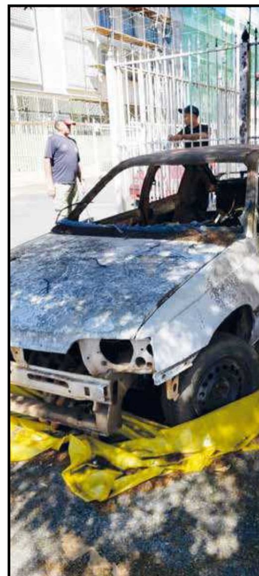
Esta carcaça está parada num beco da QI 3 e apesar dos pedidos da Vigilância não foi retirada pelo Detran