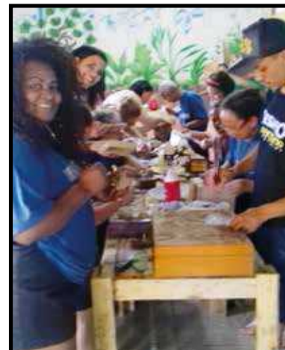
Ações fazem parte das comemorações do Dia Mundial do Meio Ambiente

Teve início nessa terça-feira, (4 de junho), no Centro de Educação Ambiental da Horta Comunitária do Guará, com a oficina Técnicas de Reciclagem de Resíduos Sólidos, a programação Semana do Meio Ambiente, que abordará diversas atividades ligadas à sustentabilidade em comemoração ao Dia Mundial do Meio Ambiente celebrado na quarta-feira (5 de maio). O evento gratuito segue durante o mês com atividades envolvendo oficinas, palestras e gincana.