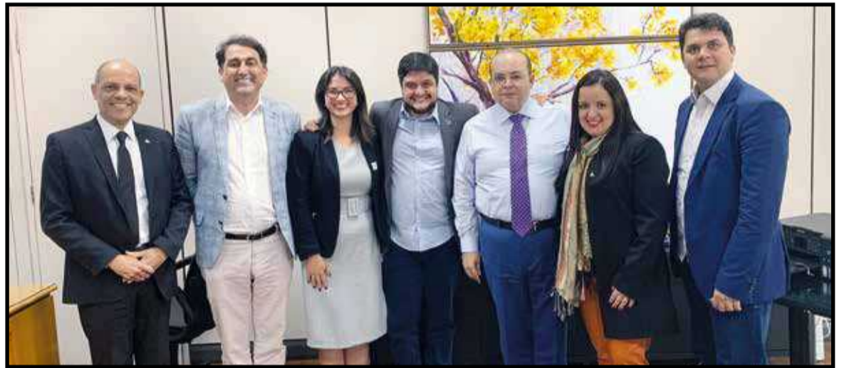
Reunião da semana com Ibaneis selou a decisão de construir o novo hospital

A previsão é que o projeto seja concluído até o final deste ano e a construção seja iniciada em até dois anos, prazo para a viabilização dos recursos e a licitação da obra.