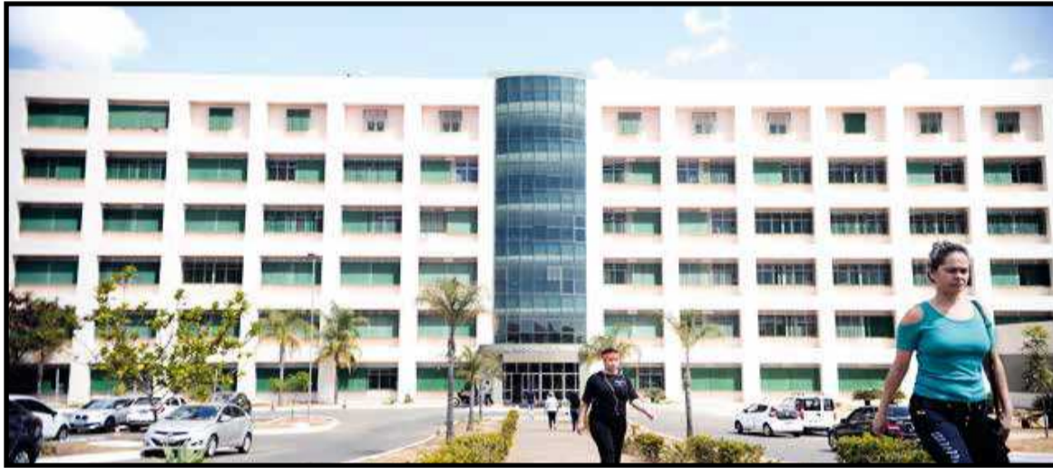
A planta do Hospital de Santa Maria ser4 usada para o projeto do hospital do Guar4