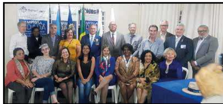
Governador e os socios do clube durante a visita oficial. Abaixo, na visita ao Lar So Francisco de Assis

Um dos mais conhecidos projetos do Rotary Internacional  a campanha mundial de combate  poliomielite