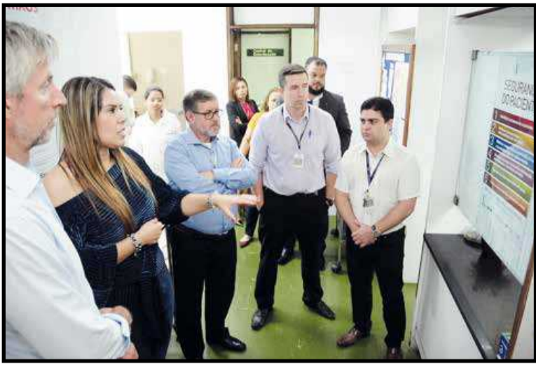
Representantes do BID foram ao atual hospital do Guará para comprovar a necessidade de outro bem maior