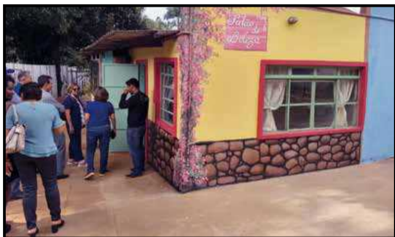
Com a ajuda de parceiros, o clube reformou o salo de beleza do Lar So Francisco de Assis

da em 1989. Atravs da Fundao Rotria, o seu brao filantrpico, o Rotary Internacional promove e financia campanhas de alfabetizao e oferece bolsas de estudos e intercmbios de jovens entre pases.