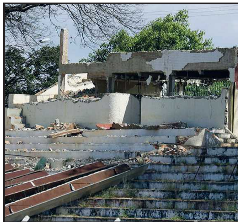
Obras do estádio foram interrompidas ainda no início. Agora, a iniciativa privada deve assumir a conclusão

execução do projeto poderia ser facilmente pago com a descoberta de apenas um ou dois talentos, considerando que Brasília tem se mostrado um celeiro de jogadores que fizeram sucesso no futebol brasileiro. A intenção desse clube é montar um time profissional e disputar o Campeonato Brasileiro, para dar experiência aos talentos descobertos e aproveitar para colocar em atividade jogadores que estejam sobrando no seu elenco. Enquanto isso, passa a explorar o complexo, que prevê a construção de uma praça de alimentação, um clube social, um novo ginásio coberto e novos espaços esportivos.