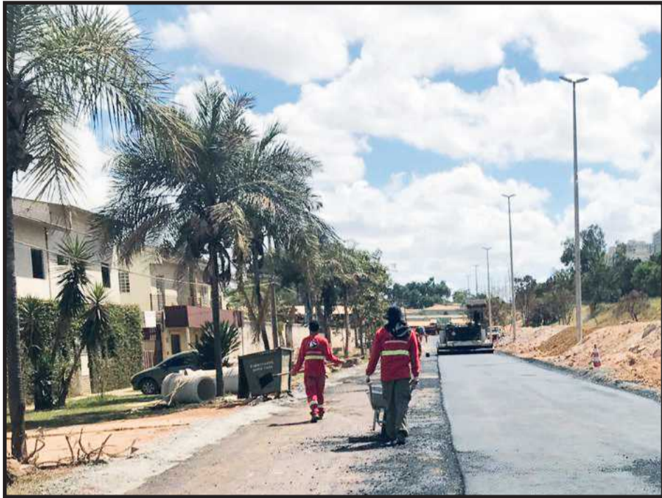
Serviços estão sendo intensificados para que homens e máquinas aproveitem o período de estiagem

Retomadas em julho deste ano, as obras de infraestrutura no lote 3 do Setor Habitacional Bernardo Sayão já apresentam resultados para a população: os serviços de asfaltamento, tão aguardado pelos moradores, estão a todo vapor.