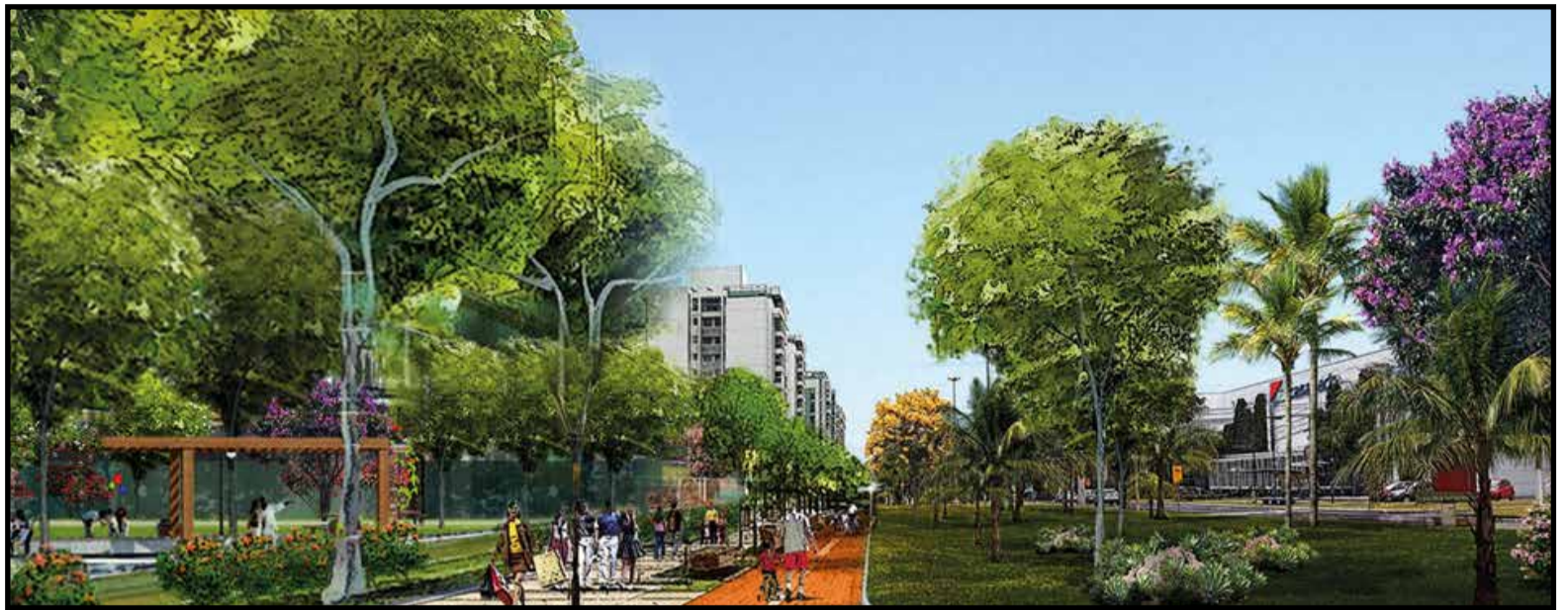
No Park Sul a via ganha as características de Estrada Parque

De acordo com o secret4rio Everardo Gueiros, se o projeto n4o exigir novos ajustes, a licita4o pode ser lan4ada at4 o final deste ano, depois que o governo concluiu mobiliza4o pela privatiza4o da Arena Plex (Est4dio Man4 Garrincha, gin4sios Cl4udio Coutinho e Nilson Nelson). “O objetivo 4 unir os dois lados das cidades do Eixo Sul, segregadas pelas linhas de alta tens4o e do metr4, que se deparam diariamente com uma esp4cie