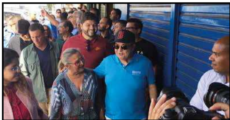
O governador Ibaneis Rocha anunciou o projeto de revitalização das feiras do DF, durante visita à Feira de Guariroba

uma de suas bancas é uma concessão pública. Cada banca é cedida para uma pessoa que pode explorá-la da maneira que quiser, desde que não venda, alugue ou ceda seu espaço. Mas, ao longo dos anos, e de seguidos recadastramentos, a maioria das bancas já mudou de dono várias vezes. Por conta da situação atual, o local onde os feirantes investem e trabalham não são seus e não constituem patrimônio. Por outro lado, o governo gasta muito para manter as feiras, que funcionam como mercados populares, e poderiam ser geridos pelos próprios comerciantes. Esta insegurança jurídica impede que os feirantes