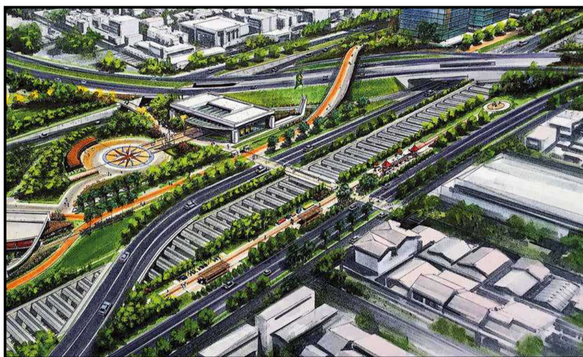
O centro do Guar4 ser4 completamente remodelado, integrando a avenida com a estaç4o do metr4 e uma futura estaç4o ferrovi4ria

Cerca de 200 pessoas, principalmente moradores do Setor de Oficinas Sul e do Guar4, acompanharam a exposiç4o e o detalhamento do projeto e depois tiveram a oportunidade de emitir suas opini4es. Em contraponto ao otimismo do governo, a maior parte do p4blico se posicionou contra a implantaç4o da via como est4 prevista, por raz4es ambientais, como 4 o caso dos defensores do Parque do Guar4, ou por afetar diretamente a comodidade dos moradores, como reclamaram as lideranç4s comunit4rias do Park Sul, onde est4o os condom4nios Living,