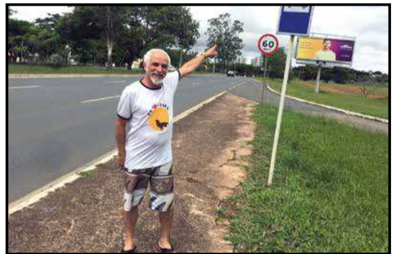
Fuíca reclama do perigo que é também pegar um ônibus no local. Mesmo com espaço de sobra, não há recuo na pista