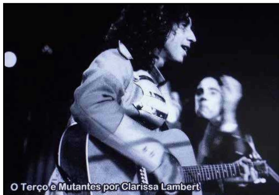
O Terço e Mutantes por Clarissa Lambert