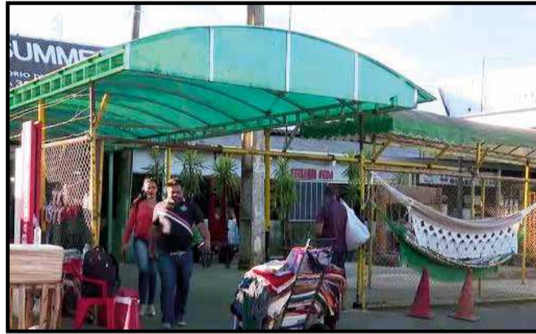
Ambulantes concorrem diretamente com o comércio legalmente estabelecido na Feira do Guará