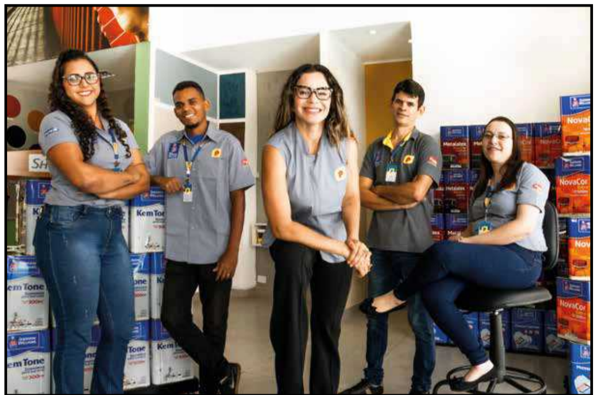
A nova equipe da Polar Tintas do Guará foi treinada para orientar os clientes sobre o que e como comprar para garantir a qualidade da pintura pelo menor preço. Na loja há tecnologia para a escolha de mais de 5 mil cores (abaixo)

dadas aos clientes sempre que procuram a Polar Tintas do Guará, gratuitamente. Basta levar a metragem da área a ser pintada, fotos do local e explicar para os consultores qual o resultado desejado.