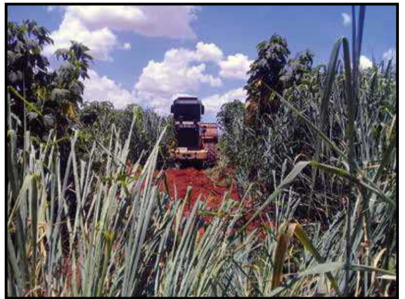
Com muitos lotes ainda vazios, mato alto e entulho tomam conta das novas quadras do Guará

Somente em 2019 foram limpos aproximadamente 2 mil lotes no período da campanha. Do começo deste ano até agora, mais de 400 lotes já receberam a assistência. Ainda há a previsão para outros 1,7 mil.