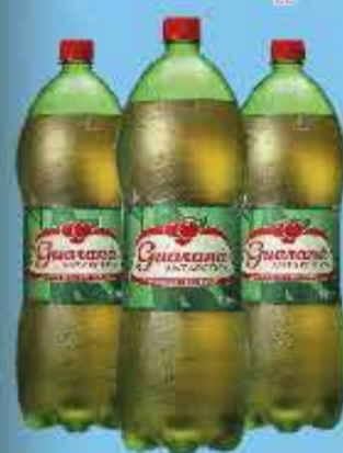
Guaraná Antarctica 1L

A partir de 12 unidades R$ 2,79 CADA Varejo - R$ 2,99