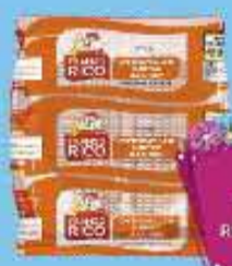
Filé de Peito de Frango Rico 1kg

A partir de 6 unidades R$ 2,79 CADA Varejo - R$ 2,99