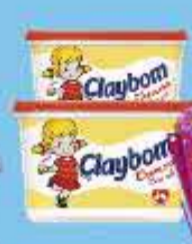
Margarina Claybom com Sal 500g

A partir de 3 unidades R$ 2,49 CADA Varejo - R$ 2,79