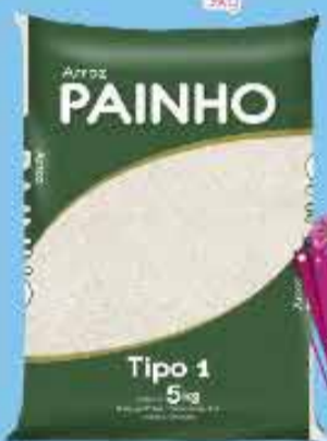
Arroz Painho 5kg

OFERTAS VÁLIDAS PARA TODAS AS LOJAS DO DISTRITO FEDERAL DE 05 A 11/03/2020 OU ENQUANTO DUPAREM OS ESTOQUES.