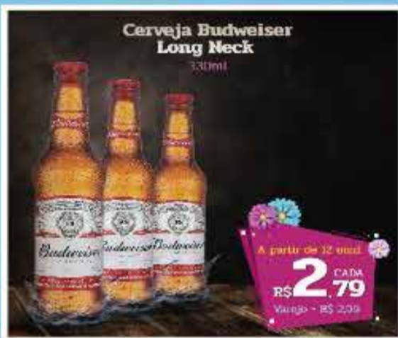
Cerveja Budweiser Long Neck 330ml

A partir de 12 unidades R$ 2,79 CADA Varejo - R$ 2,99