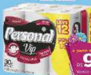
Papel Higiênico Personal Neutro 12 Rolos

A partir de 3 unidades R$ 9,49 CADA Varejo - R$ 9,99