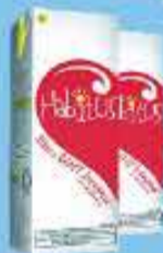
Leite Longa Vida Integral Habitus 1L