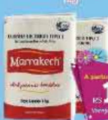
Farinha de Trigo Marrakech 1kg

A partir de 6 unidades R$ 1,89 CADA Varejo - R$ 2,09