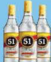
Aguardente 51 500ml

A partir de 6 unidades R$ 1,39 CADA Varejo - R$ 1,59