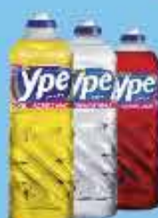
Detergente Líquido Ypê 500ml

A partir de 6 unidades R$ 1,39 CADA Varejo - R$ 1,59