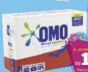
Sabão em Pó Omo Lavagem Perfeita 2,2kg

16% A partir de 3 unidades R$ 11,99 CADA Varejo - R$ 12,99