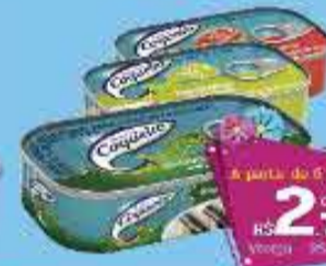
Sardinha Coqueiro 150g

A partir de 6 unidades R$ 2,79 CADA Varejo - R$ 2,99