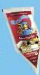
Requeijão Cremoso Garotão 1kg