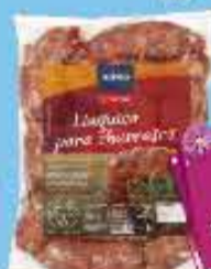
Linguiça para Churrasco Cozinha Premiada 1kg