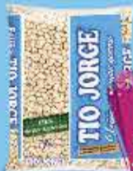
Feijão Carioca Tio Jorge 1kg