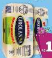
Queijo Mussarela Girolanda 1kg