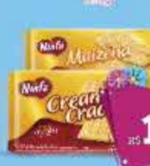
Biscoito Ninfa Cream Cracker ou Maizena 500g

A partir de 6 unidades R$ 1,89 CADA Varejo - R$ 2,09