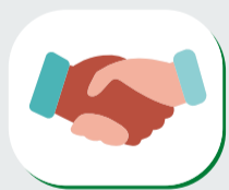
Toque ou aperto de mãos