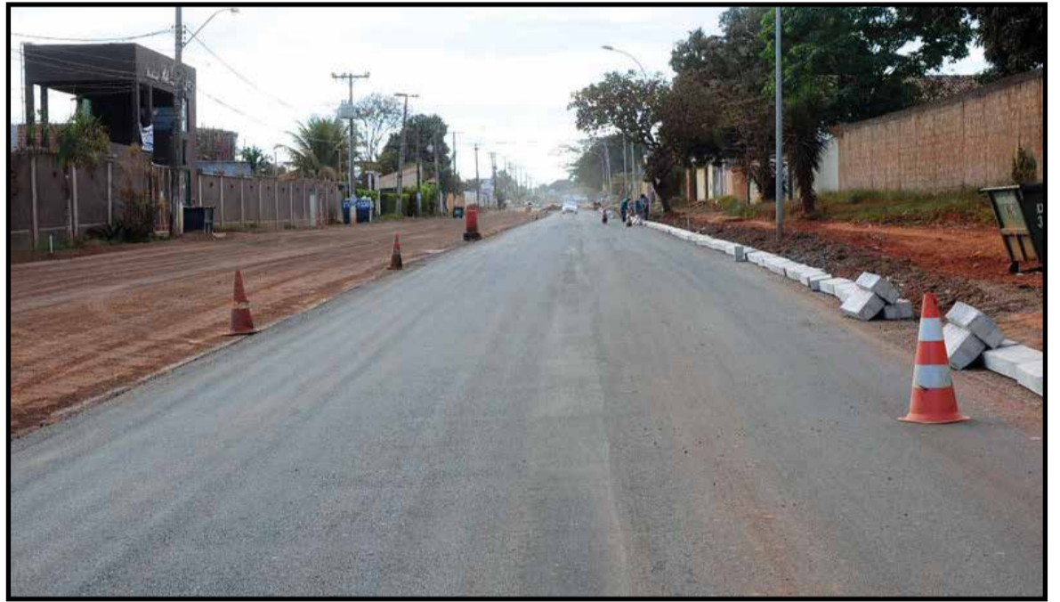
Asfaltamente está quase todo completo, falta ainda parte da rede de captação de águas pluviais

“Durante o período chuvoso, avançamos nas obras de drenagem. Com a chegada do período seco, vamos focar na pavimentação e sinalização. A expectativa é alta quanto à conclusão total dos serviços