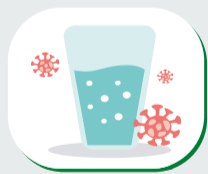
Objetos ou superfícies contaminados